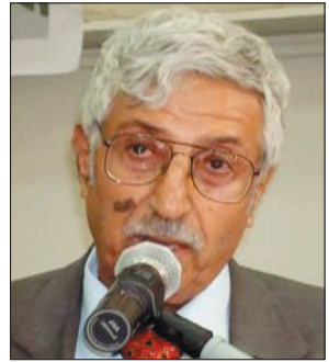
وأكد رئيس فرع أدباء عدن أن الدكتور عبدالعزيز المقال قدم الكثير من الأعمال الشعرية إلى

جانب كتاباته النقدية والتي تؤكد في مجملها عبقرية تجربته وعظمة منجزه الإبداعي اليمني العربي والذي تجلى فيه جديراً بالفوز بهذه الجائزة العربية كأحد من الشعراء العرب المتميزين الذين يدخلون أبواب التاريخ بتجربة إبداعية إنسانية عظيمة وروح وطنية تجسد حب الوطن ومعاييره السامية . وأعلن في القاهرة مساء الخميس عن فوز شاعر اليمن الكبير الدكتور عبدالعزيز المقال بجائزة ملتقى القاهرة الثالث للشعر العربي تقديرًا لعمارة الإبداعية وتكريماً لتجربته الشعرية الرائدة.