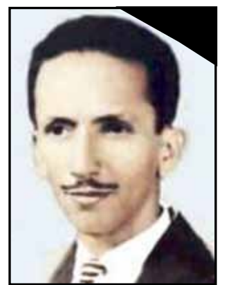
الشهيد / عبدالباري قاسم مؤسس صحيفة 14 أكتوبر