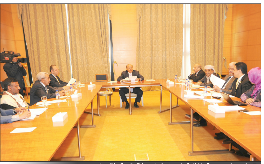
■ رئيس الجمهورية خلال ترؤسه اجتماع هيئة رئاسة مؤتمر الحوار

أعضاء لجنة الانضباط والمعايير وتزكيتهم من قبل اعضاء المؤتمر ومتابعة سير اعمال اللجان والتدقيق البرامجي وتدوين الاحظات والكلمات ودراسة الاداء بصورة حثيثة ودقيقة. حضر الاجتماع امين عام مؤتمر الحوار الوطني الدكتور احمد بن مبارك والمبعوث الأممي لليمن جمال بن عمر.