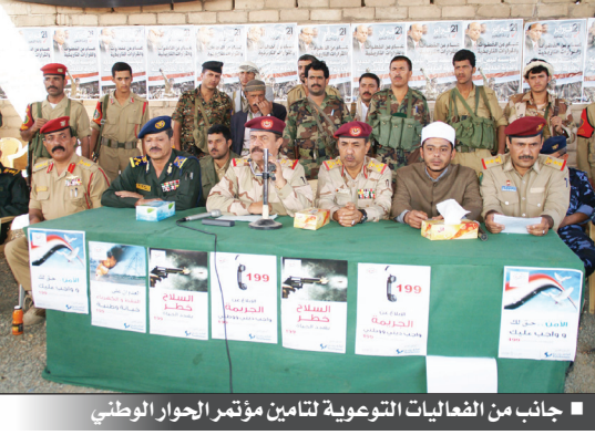
■ جانب من الفعاليات التوعوية لتأمين مؤتمر الحوار الوطني

نفذت امس فعاليات توعوية حول دور القوات المسلحة والأمن في تأمين الظروف الملائمة لنجاح مؤتمر الحوار الوطني. ففي محور تعز نفذت الفعاليات أمام منتسبي اللواء 22 مدرع حيث اشارت الكلمات والمحاضرات إلى ان القيادة السياسية ومعها كافة القوى السياسية والاجتماعية والوطنية يساندها الخيرون من الأشقاء والأصدقاء بذلت - وما تزال - الجهود الكبيرة لانجاح مؤتمر الحوار الوطني الذي انطلق أمس الاول - وستمثل نتائجه مخرجا وحيدا للوطن من مهددات الانقسامات ونذر الصراعات الكارثية. وأشارت الكلمات والمحاضرات إلى ان صهر المبادئ الوطنية في إطار الحوار الوطني الشامل سيهد التوجه الرسمي والشعبي إلى المسار الصحيح والمضي قدما باتجاه التغيير المنشود والتحديث والتأسيس لبناء اليمن الجديد، يمين العدالة والمساواة والحكم الرشيد. وفي محور الحديدة نفذت الحملة برنامجها أمام منتسبي مركز تدريب القوات الخاصة واللواء 10 صاعقة (عمليات خاصة) بحضور قائد المركز واللواء حيث أكدت الحملة ان المؤسسة العسكرية والأمنية مدعوة اليوم إلى النهوض بالمهام والواجبات الوطنية المؤكدة إليها والاضطلاع بالمسؤوليات الجسام التي تقع على عاتق هاتين المؤسستين. وفي المنطقة العسكرية الجنوبية نفذت