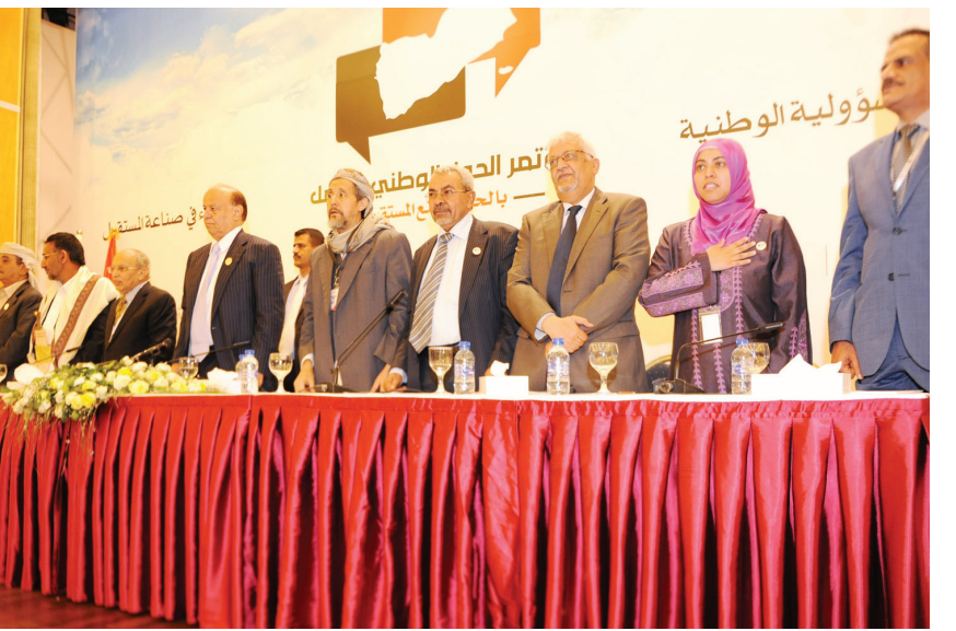
■ انشاء توزيع دليل مؤتمر الحوار

ادعوكم أن تتحلوا جميعا بدرجة عالية من المسؤولية الوطنية والالتزام بحقوق الانسان والقانون الدولي والأخلاق اليمينية والاسلامية الاصيلية والحرص الوطني الكبير على تغليب الصلحة العامة على المصالح الشخصية والحزبية الضيقة. وصف الأخ رئيس الجمهورية المشاركين والمشاركات في مؤتمر الحوار بأنهم صناع المستقبل.. مشددا على أنهم مسؤولون امام الله تعالى أولا وثم امام الشعب وأمام من يمثلونهم في هذه المهمة الوطنية التاريخية. وأشار الى ان جماهير الشعب تنتظر من هذا المؤتمر الخروج بنتائج مشرفة تحقق التطلعات والغايات الوطنية في سبيل بناء اليمن الجديد وترجم آمالها في وطن نيعم كل انائه بالسلام والاستقرار والتقدم.. سانلا المولى عز وجل أن يوفق الجميع ويسدد على طريق الاستقرار والتقدم والنماء خطاهم.