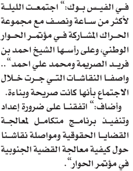
■ جمال بن عمر

التقى المستشار الخاص للأمين العام للأمم المتحدة ومبعوثه إلى اليمن جمال بن عمر أمس في صنعاء بمجموعة من قيادات وممثلي الحراك الجنوبي السلمي المشاركين في مؤتمر الحوار الوطني الشامل وفي مقدمتهم نائب رئيس مؤتمر الحوار أحمد بن فريد الصريفة ومحمد علي أحمد. وقال بن عمر في بيان مقتضب نشره مساء امس على صفحته الرسمية في الفيس بوك: «اجتمعت الليلة لأكثر من ساعة ونصف مع مجموعة الحراك المشاركة في مؤتمر الحوار الوطني، وعلى رأسها الشيخ احمد بن فريد الصريفة ومحمد علي احمد... واصفا النقاشات التي جرت خلال الاجتماع بأنها كانت صريحة وبناءة. وأضاف: اتفقنا على ضرورة إعداد وتنفيذ برنامج متكامل لمعالجة القضايا الحقوقية ومواصلة نقاشنا حول كيفية معالجة القضية الجنوبية في مؤتمر الحوار».