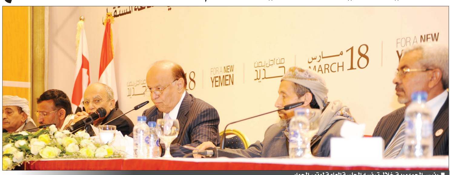
■ رئيس الجمهورية خلال ترؤسه الجلسة العامة لمؤتمر الحوار

التى سيتم بثها مباشرة لتكونوا تحت عين شعبكم تجسيدا لمبدأ العلنية والشفافية وحق المواطنين في المتابعة الحثيثة لمجريات هذا المؤتمر الوطني الكبير الذى سيرسم صورة مستقبل اليمن المشرق والجديد. وأضاف «وهذا النقل المباشر لفعاليات جلساتكم العامة سيلقى عليكم الكثير من المسؤولية.. فمن واجبك ان تبعثوا الامل في نفوس ما يقارب أربعة وعشرين مليون يمني سينتظرون منكم الكثير الإيجابي» وخاطب الأخ الرئيس المشاركين والمشاركات في مؤتمر الحوار الوطني قائلا: يجب عليكم ان تستفيدوا من الجلسات العامة، التى يفترض ان تمتد لأسبوعين كحد أقصى في هذه المرحلة الأولى، وذلك لكسر