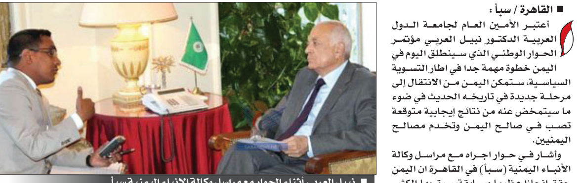
نبيب العربي أثناء الحوار مع مراسل وكالة الأنباء اليمنية سبأ

القاهرة / سبأ: اعتبر الأمين العام لجامعة الدول العربية الدكتور نبيل العربي مؤتمر الحوار الوطني الذي سينطلق اليوم في اليمن خطوة مهمة جداً في إطار التسوية السياسية، ستمكن اليمن من الانتقال إلى مرحلة جديدة في تاريخه الحديث في ضوء ما سيتمخض عنه من نتائج إيجابية متوقعة تصب في صالح اليمن وتخدم مصالح اليمنيين. وأشار في حوار أجراه مع مراسل وكالة الأنباء اليمنية (سبأ) في القاهرة أن اليمن حقق إنجازاً عظيماً وسابقة، سبق بها الكثير من الدول العربية التي تتطلب حل مشاكلها وقضاياها بالحوار، معتبراً أن اليمن صاحب الفضل والسبق في هذا الجانب عربياً. وعبر الدكتور العربي عن ثقته في أن اليمنيين المشاركين في الحوار سيدخلون إلى المؤتمر بعقل وقلب مفتوح، ليتمكنوا من الوصول إلى ما يمكن الاتفاق عليه لخدمة اليمن، داعياً الأطراف التي لم تشارك إلى الحرص على المشاركة وأن يكون لديهم الاستعداد للتفاهم وقبول الآخر. وأشاد الأمين العام للجامعة العربية بالحوار الذي يمكن الاتفاق عليه لخدمة اليمن، داعياً الأطراف التي لم تشارك إلى الحرص على المشاركة وأن يكون لديهم الاستعداد للتفاهم وقبول الآخر.