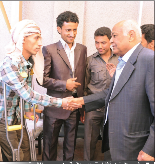
رئيس الوزراء أثناء توديع دفعة من جرحى الثورة

صنعاء / سبأ: ودع رئيس مجلس الوزراء الأخ محمد سالم باسندوة دفعة جديدة من مصابي وجرحى الثورة وعددهم 34 جريحاً والمقرر سفرهم إلى القاهرة لتلقي العلاج، في إطار برنامج الحكومة لمعالجة جرحى ومصابي الثورة من الذين تستدعي حالاتهم الصحية استكمال علاجهم في المستشفيات والمراكز الصحية المتخصصة في عدد من الدول العربية والأجنبية. وأعرب الأخ باسندوة عن تمنياته للمصابين بالشفاء العاجل وان يعودوا إلى أسرهم ووطنهم بكمال الصحة والعافية.. مؤكداً ان الحكومة ستتابع حالات جميع المصابين والجرحى دون استثناء لآحد ومعالجتهم في أي مكان حتى يتمثلوا للشفاء الكامل بأذن الله تعالى. بدورهم عبر المصابون والجرحى عن تقديرهم لما توليه الحكومة من اهتمام ورعاية وحرص على معالجة الجرحى.. شاكرين الدور الشخصي لالأخ رئيس الوزراء وحرصه الكبير ومتابعته الدائمة لموضوع معالجة الجرحى سواء في الداخل أو الخارج.