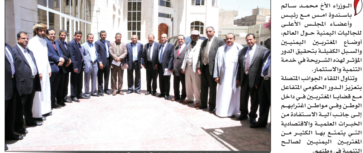
باسندوة مع أعضاء المجلس الأعلى للجاليات اليمنية حول العالم

صنعاء / سبأ: ناقش رئيس مجلس الوزراء الأخ محمد سالم باسندوة أمس مع رئيس وأعضاء المجلس الأعلى للجاليات اليمنية حول العالم، أوضاع المغتربين في داخل الوطن وفي مواطن اغترابهم المؤثر لهذه الشريحة في خدمة التنمية والاستثمار. وتناول اللقاء الجانب المتصلة بتعزيز الدور الحكومي المتفاعل مع قضايا المغتربين في داخل الوطن وفي مواطن اغترابهم إلى جانب الية الاستفادة من الخبرات العلمية والاقتصادية التي يتمتع بها الكثير من المغتربين اليمنيين لصالح التنمية في وطنهم. ونوه الأخ باسندوة أثناء اللقاء بالدور الحيوي للمغتربين في خدمة الاقتصاد الوطني في مختلف المراحل السابقة.. وأكد أن قضايا المغتربين هي على الدوام محل اهتمام الحكومة انطلاقاً من الخدمات الجليلة التي يقدمونها لوطنهم.. ولفت رئيس الوزراء إلى ما تبذله الحكومة من جهود في سبيل تهيئة الأجواء اللازمة التي من شأنها ضمان الاستقرار المطلوب لنجاح استثماراتهم ومشاريع المستثمرين الآخرين سواء المحليين أو الأجنبي بما في ذلك تحقيق الأرباح الفاعل في خدمة الاقتصاد والمجتمع. وقال، نريد أن يستفيد الوطن وبشكل منهجي من خبرات أبنائه المغتربين العرفية والاقتصادية وعلى النحو الذي يؤدي إلى خدمة التنمية والمساهمة الفاعلة في توفير فرص العمل الواسعة والمتعددة أمام طالبي العمل من الشباب وغيرهم.. من جانبه عبر وزير المغتربين مجاهد القهالي عن تقدير جميع المغتربين وتثمينهم لقرارات حكومة الوفاق الوطني ورئيسها الدائمة للمغتربين والمستجيبة لتطلعاتهم من حكومة وطنهم الأم.. وكشف للجاليات اليمنية الذين عبروا عن تقديرهم الكبير للرعاية والاهتمام الذي توليه حكومة الوفاق الوطني