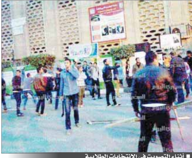
أثناء التصويت في الانتخابات الطلابية