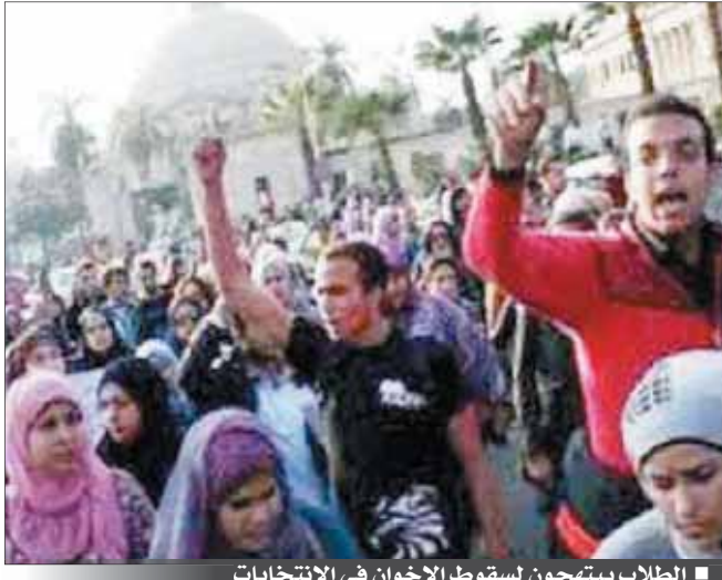
الطلاب يبهجون لسقوط الإخوان في الانتخابات