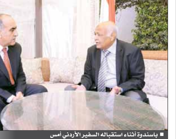
باسندوة أثناء استقباله السفير الأردني أمس

■ صنعاء / سبأ: تسلم رئيس مجلس الوزراء الأخ محمد سالم باسندوة رسالة من حكومة المملكة الأردنية الهاشمية تتضمن دعوته للمشاركة في أعمال الاجتماع السابع للمنتدى الاقتصادي العالمي الذي تستضيفه الأردن خلال الفترة من 24 إلى 26 مايو 2013م. وقد قام بتسليم الرسالة السفير الأردني بصنعاء سليمان الغوييري، أثناء استقبال الأخ رئيس الوزراء له أمس، حيث جرى بحث العلاقات الثنائية بين البلدين وسبل تنميتها وتطويرها في المجالات الاقتصادية والسياسية والثقافية والاجتماعية، والشقيقتين. ونوه الأخ باسندوة خلال اللقاء بالحرص المتبادل على توطيد العلاقات الاخوية اليمنية الأردنية والدفع المستمر بها نحو آفاق رحبة من العمل المثمر.. متمنيا للاردن الشقيق دوام الاستقرار والتطور في كافة المجالات. من جانبه أكد السفير الأردني خصوصية العلاقات التي تجمع البلدين والشعبين الشقيقين الأردني واليمني.. معربا عن تطلع بلاده إلى نجاح مؤتمر الحوار الوطني المقبل بما يمثله ذلك من أهمية كبيرة على حاضر ومستقبل اليمن.