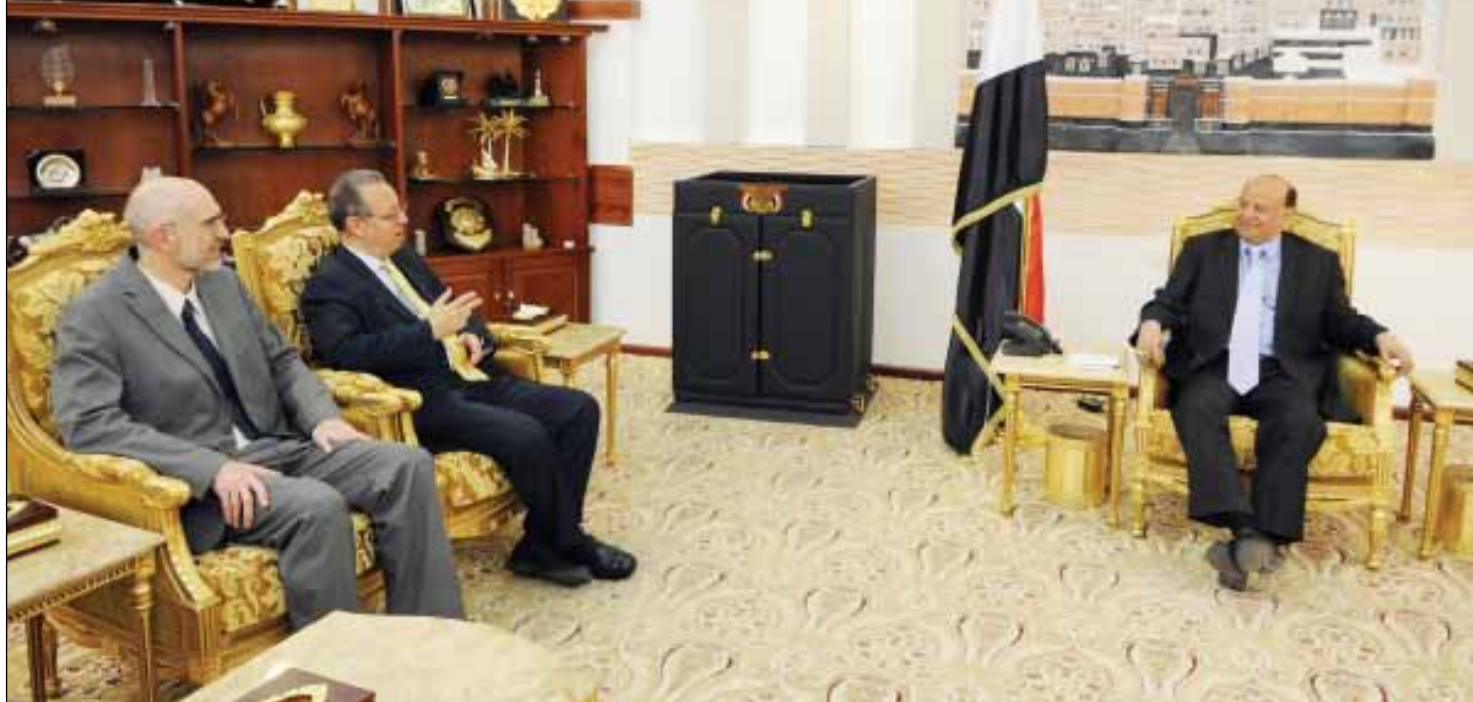
رئيس الجمهورية لدى استقباله جمال بن عمر أمس

■ صنعاء / سبأ: استقبل الأخ الرئيس عبد ربه منصور هادي رئيس الجمهورية أمس، المبعوث الأممي إلى اليمن مساعد الأمين العام للأمم المتحدة جمال بن عمر الذي وصل إلى صنعاء قادما من دبي. وجرى خلال اللقاء استعراض التطورات والمستجدات على صعيد التحضير الكامل لمؤتمر الحوار الوطني الشامل الذي ستطلق أعماله في الثامن عشر من مارس الحالي. وأشار بن عمر إلى ان لقاءاته مع قيادات المعارضة الجنوبية في الخارج في دبي كانت مثمرة وإيجابية وتؤكد استشعار الجميع بان هناك فرصة تاريخية لمعالجة كافة القضايا اليمنية والمشاكل العالقة وهي المقدمة القضائية الجنوبية، خصوصا وان العالم بأسره يدعم التسوية السياسية في اليمن على أساس المبادرة الخليجية وألبيتها التنفيذية المزممة وقراري مجلس الأمن رقم 2014 و2051. وأشار إلى انه أوضح خلال لقاءاته أن المبادرة الخليجية والقرارات الدولية جاءت باسم الجمهورية اليمنية التي انبثقت عن كيانين توحدوا في الثاني والعشرين من مايو عام 1990م من القرن الماضي ولقيت التأييد والاعتراف من المجتمع الدولي كله والرعاية الدولية موجودة على