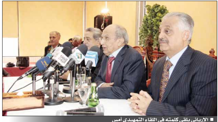
الإيراني يلقي كلمته في اللقاء التمهيدي أمس

■ صنعاء / بشير الحزمي: أكد المستشار السياسي لرئيس الجمهورية رئيس اللجنة الفنية للحوار الوطني الدكتور عبد الكريم الأرياني أن الإعلام يستطيع أن يلعب دورا إيجابيا مؤثرا جدا في إنجاح الحوار الوطني. وقال في اللقاء التمهيدي لدورة الحوار الوطني ومواكبة ونهية أجواء الحوار الوطني ودعم عملية التحول الديمقراطي التي نظمها يوم أمس بالعاصمة صنعاء مؤسسة اليمن للثقافة والتنمية السياسية انه بدون إعلام إيجابي لن يمر الحوار الوطني بسلا.. موضحا ان الإعلام بمختلف وسائله قد لعب في عام 2011 دورا سلبيا لا يفاخر به. وأكد ان المسئولية الوطنية تقع على كاهل الجميع والمكتنوا أكثر فضلا على كاهل الإعلام ومحوري المواقع ورؤساء تحرير الصحف. مطالبا بأن يكون الإعلام رافدا للحوار الوطني وليس عبئا عليه وهي مسئولية وطنية كبرى. وقال ان الحوار الوطني أصبح اليوم واقعا لا تفصلنا عنه إلا أيام معدودة.. لافتا إلى ان اللجنة الفنية للحوار على وشك انهاء مهمتها والتحضيرات للمؤتمر سارية على قدم وساق. وعبر الأرياني عن امله بأن تخرج الندوة المرتقبة لدور الإعلام في مواكبة ونهية أجواء الحوار الوطني بميثاق شرف يتفق عليه ويلتزم به الجميع بأن الأجواء لن تكون متوترة ولا مسببة لاحتكاكات داخل اجتماعات الحوار الوطني. من جانبه أكد رئيس مجلس الأمناء مؤسسة