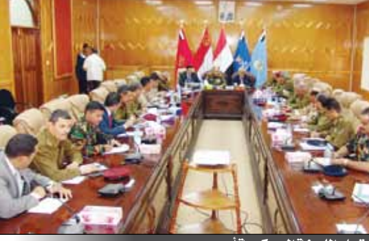
جانب من اجتماع اللجنة العسكرية أمس