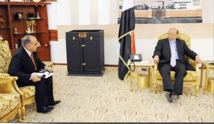
الرئيس لدى استقباله السفير الأردني أمس