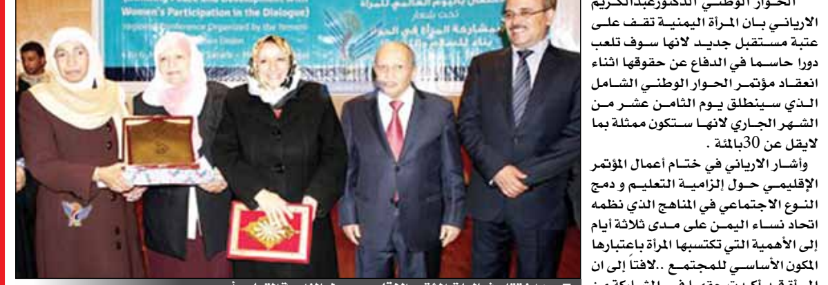
من اختتام فعاليات المؤتمر الإقليمي حول إلزامية التعليم أمس

يحقق آمال المرأة ويحد من تسرب الفتيات من المدارس.. مشيرة إلى تزامن الاحتفال باليوم العالمي للمرأة مع اختتام المؤتمر الإقليمي حول إلزامية التعليم ودمج النوع الاجتماعي في المناهج حيث وجد اتحاد نساء اليمن والأمانة العامة للاتحاد النسائي العربي مناسبة للاحتفال بيوم المرأة العالمي وتكريسه مفهوم مؤتمر الحوار الوطني.. مؤكدة ضرورة المشاركة الفاعلة للمرأة في لجان الحوار باعتبار مشاركة المرأة في كل المجالات السياسية والاقتصادية والقانونية وفي مواقع صنع القرار أساس الاستقرار والتنمية والسلام. وأشارت إلى أهمية مؤتمر الحوار الوطني الذي يمثل خطوة مهمة على طريق تأسيس الدولة المدنية الحديثة المنشودة والقائمة على