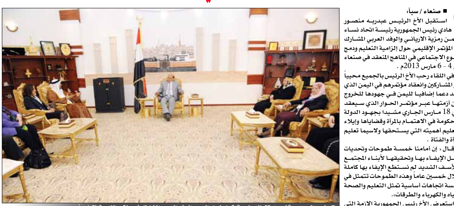
رئيس الجمهورية لدى استقباله رئيسة اتحاد نساء اليمن والوفد العربي المشارك في مؤتمر إلزامية التعليم أمس

تقديرهم وتمنيهم للنجاحات التي تحققت في طريق التسوية السياسية لليمن وتنفيذ المبادرة الخليجية وما بذله الأخ الرئيس عبدربه منصور هادي من جهود استثنائية. وتمنوا لليمن الوصول إلى الغايات المرجوة من خلال نجاح الحوار الوطني الشامل.. مشيدين بالمساندة والدعم الذي يلقاه اليمن على المستوى الإقليمي والدولي وإخراجه إلى بر الأمان. وقد رفع المشاركون بالمؤتمر بريقة لأخ الرئيس جاء فيها: نحن المشاركون والمشاركات في إعمال المؤتمر الإقليمي «لإلزامية التعليم ودمج النوع الاجتماعي في المناهج، 4 - 6 مارس 2013م نتقدم لكم بأسمى آيات الشكر والتقدير على رعائكم الكريمة لأعمال المؤتمر الذي عقده اتحاد نساء