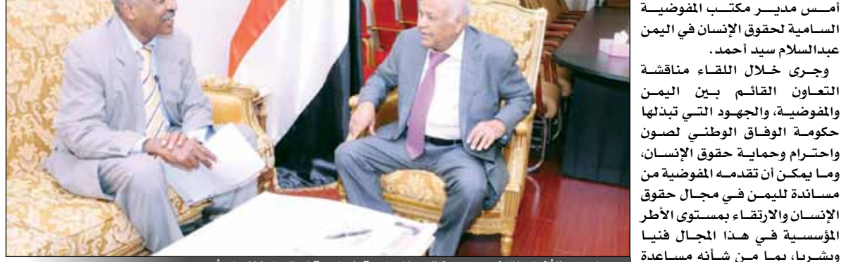
بإستدوة أثناء لقائه مدير مكتب المفوضية السامية لحقوق الإنسان أمس

بإدوره أكد مدير مكتب المفوضية في اليمن استعداد المفوضية لتقديم كافة أوجه الدعم الممكنة لمساعدة اليمن في كل ما من شأنه تعزيز احترام وحماية حقوق الإنسان. كما استقبل رئيس مجلس الوزراء الأخ محمد سالم باسندوة أمس السفير الصومالي لدى اليمن إسماعيل قاسم ناجي، حيث جرى مناقشة علاقات التعاون الثنائي بين البلدين الشقيقين وسبل تعزيزها بما يخدم المصالح المشتركة للشعبين اليمني والصومالي. وتطرقت المقابلة إلى مستجدات الأوضاع على الساحة الوطنية الصومالية والخطوات التي قطعها على طريق إحلال الأمن والاستقرار الشامل للشعب الصومالي الشقيق. ووجدت رئيس الوزراء التأكيد على وقوف اليمن مع الشعب الصومالي وموازنة كافة الجهود المخلصة لتكريس