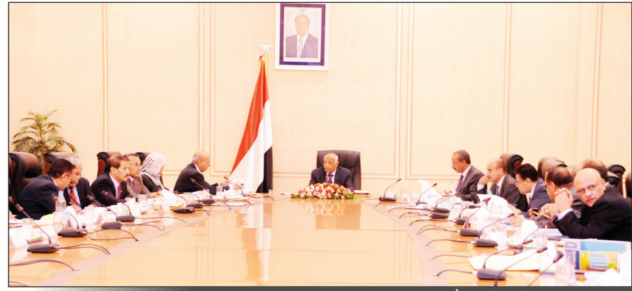
من اجتماع مجلس الوزراء أمس

مواجهة خطاب الكراهية ودرء خطر الفتنة ومحاصرة محاولات بث الفرقة والانقسام داخل الوطن، والعمل على مواجهة هذه الجرائم البشعة بكافة الوسائل القانونية والسياسية والاجتماعية والثقافية. ووجد المجلس التأكيد على احترام حكومة الوفاق الوطني الكامل لحرية الرأي وحق التعبير السلمي المكفول للجميع، في إطار الالتزام بالتعددية السياسية التي تكفل الحق في التعبير عن الآراء بأساليب حضارية بعيداً عن العنف والتحرش.. لافتاً إلى ان الدولة والحكومة لن تتهاون مع أي طرف يسعى إلى تقويض الامن والاستقرار وستقوم بواجباتها في حماية الأمن العام والسكينة العامة للمجتمع. وعبر المجلس عن تعازيه الحارة لأسر ضحايا هذه الأحداث، وتمنياته للمصابين والجرحى الشفاء العاجل وانهم سيحظون بكامل الرعاية والعناية من الحكومة.