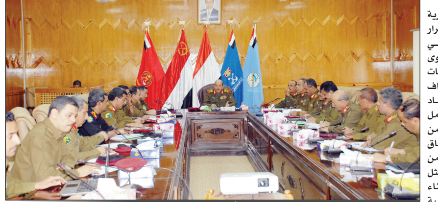
جانب من اجتماع لجنة الشؤون العسكرية أمس

خطوات ملموسة لاستعادة الطمأنينة وامتلاك إرادة الخير والسلام.. ويدرك الجميع وخاصة العقلاء من النخب السياسية والاجتماعية والثقافية والإعلامية الأهمية البالغة لإعادة الطمأنينة والثقة إلى نفوس أبناء الشعب اليمني كافة. وترى اللجنة العسكرية أن هناك أرضية مشتركة يدركها ويستوعبها الجميع ولا بد من التنبيه لها ألا وهي العملية الديمقراطية والمناخات المواتمة لها ولاستدامتها واستمرارها .. ويتوجب بدافع من الوطنية والانتماء لليمن الجديد المنشود ألا تفهم مناخات الديمقراطية بصورة مقلوقة ومعوكة خلافاً لمضامينها الراسخة وأهدافها العظيمة، مثلما هي محاولات البعض إلى إثارة وإشعال الفتنة والفوضى في بعض المحافظات، تغليب منطلقات سياسية هدامة وغير ناضجة تصل إلى حد الإفلاس ولا تستوعب حقيقة مخاطر التحديتات.. وأن مصالح الوطن العليا والأمن والسلام الاجتماعي أكبر وأهم من المصالح السياسية الضيقة التي تنحصر في حسابات أحادية وأنانية وفردية.