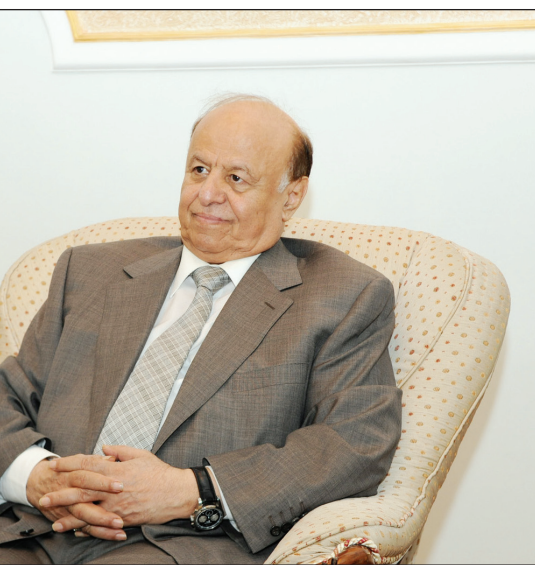
رئيس الجمهورية لدى لقائه أعضاء مجلس عدن الأهلي أمس

وداعاً الجميع إلى تحمل مسؤولياتهم في إزالة الأفكار الخاطئة والتعبئة المغلوطة من قبل الذي يغريهم سواء من الخارج أو الداخل وعلى الجميع أيضاً تقع عملية التربية الوطنية والتوعية الصحيحة والمقبولة والتي يعرفها الجميع . وأشار الأخ الرئيس إلى أن أمام اليمن فرصة تاريخية لن تتكرر والأبواب مشرعة بالحوار الوطني الجاد والمسئول على اعتبار أننا أمام مفترق الطرق والعالم إلى جانبنا في أسلوب لم يسبق له مثيل إذ أن الجميع يريدون لليمن الخروج اجتماعياً واقتصادياً.