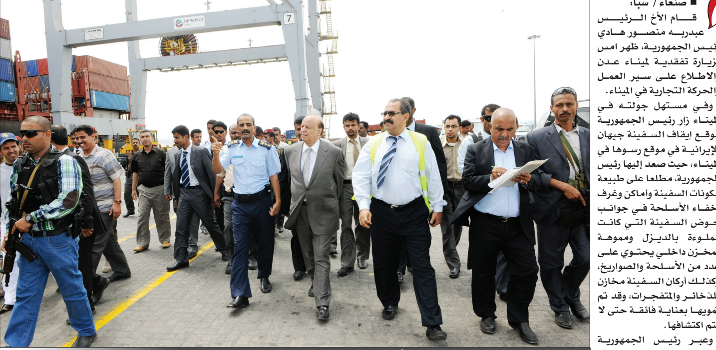
الرئيس لدى زيارته التفقدية لميناء عدن أمس

مدار الساعة. وقد أشاد الأخ الرئيس بسير العمل والنشاطات التي يقوم بها الميناء في خدمة العمل التجاري والاستثماري، وحث على تسهيل المعاملات والإجراءات لجميع المتعاملين مع الميناء وبصورة دقيقة وسريعة.