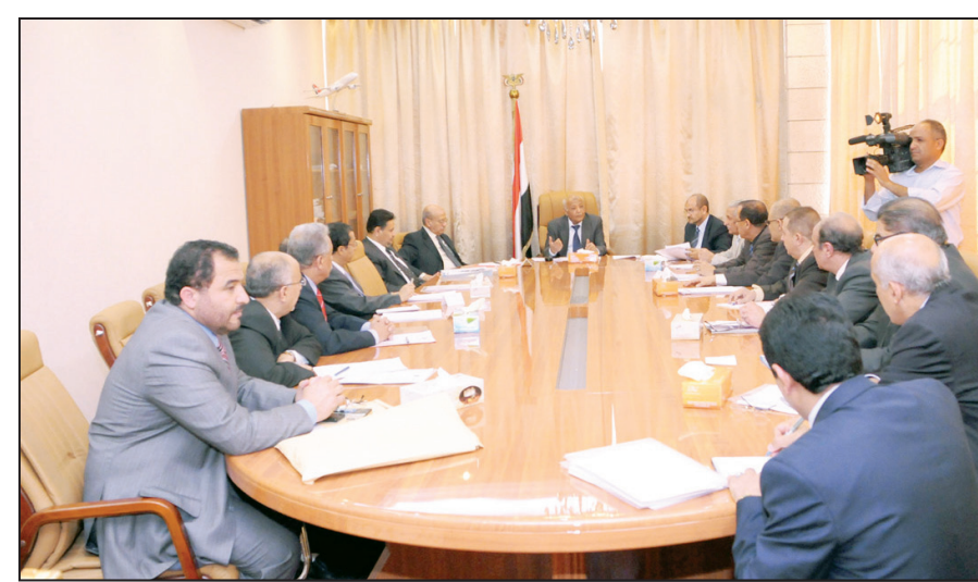
رئيس الوزراء يترأس اجتماعاً لاستيعاب تعهدات المانحين