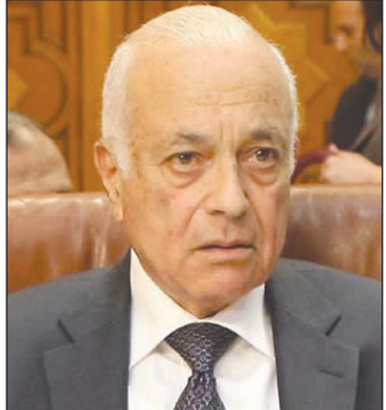
د. نبيل العربي

■ القاهرة / سيأ، رحب الأمين العام لجامعة الدول العربية الدكتور نبيل العربي بالإعلان الذي أصدره الأخ / الرئيس عبدربه منصور هادي بتحديد موعد انطلاق مؤتمر الحوار الوطني اليمني الشامل في الـ 18 من مارس المقبل. وأكد العربي في بيان صحفي أصدرته الجامعة العربية ضرورة مشاركة كافة الأطراف اليمنية في هذا الحوار وأهمية الإعداد الجيد له، وتوفير المناخ المناسب لانعقاد باعتباره السبيل الأمثل لتجاوز الصعاب وحل كافة القضايا الخلافية المطروحة، وحتى يمكن الشروع في تحقيق آمال