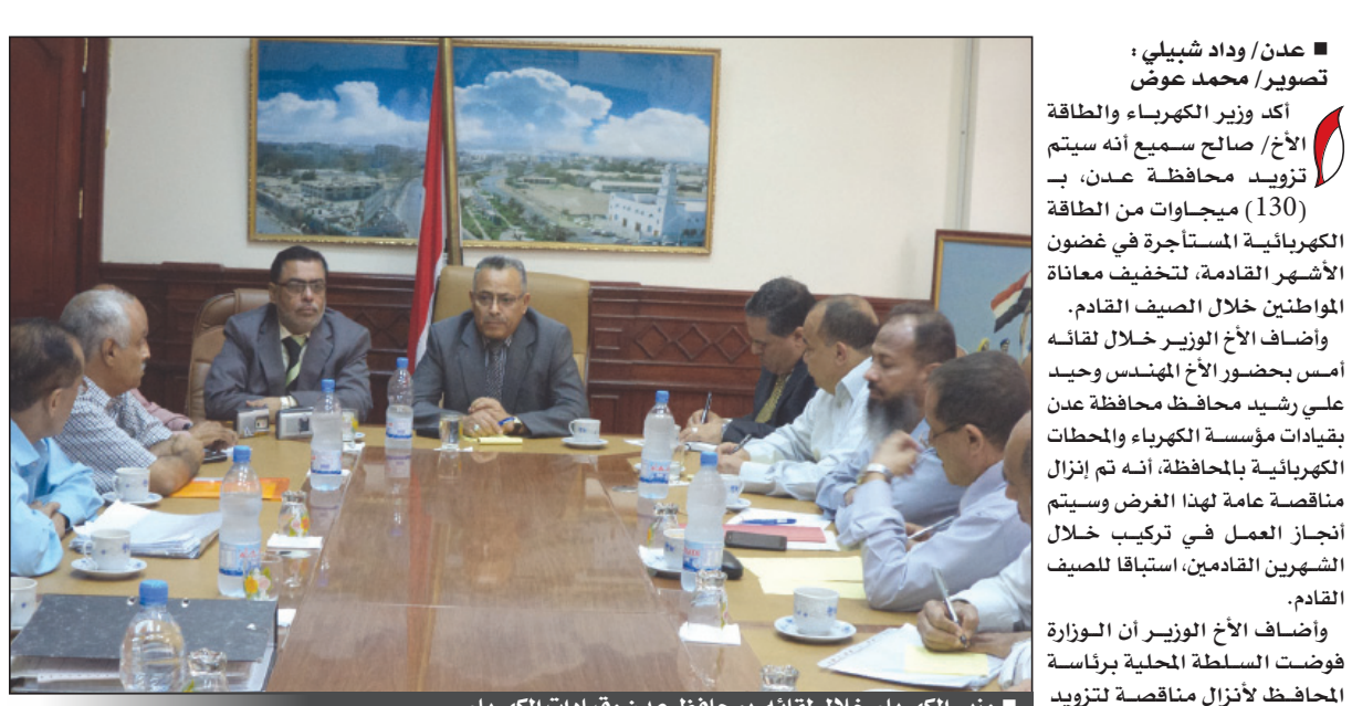
وزير الكهرباء خلال لقائه بمحافظ عدن وقيادات الكهرباء