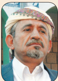
الشيخ صائق الأهمر

نطالب الحراك الجنوبي أن يعودوا إلى وطنيتهم ويفكروا كيمانيين وبمستقبل اليمن فنحن في اليمن وليس في قم، وإذا لم يتم الحوار بالطريقة التي ترضي الجميع، فإن أمر المواجهات محتمل؛ لأنه لن يتم الحوار بدون أمن.