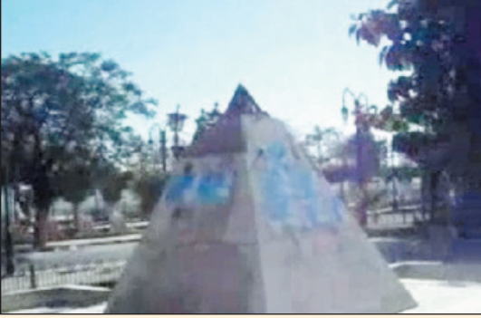
تمثال طه حسين بعد قطع الرأس