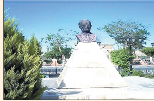
تمثال طه حسين قبل قطع الرأس

ضد رموز ثقافية وفنية مصرية، والذي سبقه قيام مجهولين بتشويه تمثال أم كلثوم، بمدينة المنصورة الأسبوع الماضي، واصفة اختفاء التمثال وإزالتته من موقعه بأنها اغتيال لعديد الأدب العربي الدكتور طه حسين . وقد سادت حالة من الارتباك بين الأجهزة الأمنية والتنفيذية بالمنيا بعد واقعة اختفاء تمثال طه حسين بمدينة المنصورة التي حدثت داخل الميدان بكورنيش النيل ، في مواجهة استراحة المحافظ حيث يعبد عنها بعشرات الأمتار.. حيث فوجئ أهالي المنيا بواقعة اختفاء التمثال المثلث على قاعدة هرمية فلم يجدوا ما تعودوا رؤيته منذ عشرات السنوات ولم يعرفوا سببا للاختفاء مما أثار غضب العديد من المواطنين والقوى السياسية بالمحافظة.