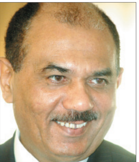
الراحل الجليل فنان الاصالة المتجددة محمد مرشد ناجي

تبيك الخلجات المكلومة في اعماق الذات وينتخب الوجدان تبيك عبون الكلمات وتلك العارية على حزن الصفحات وبدون كساء منك بازكى الالحان لم تخضر بها افياء الاصوات ودواوين الشعر المنذورة لغناء لم يات في تلك الانعام المظفورة بعطاء الروح واروع ما تقدحه الاشجان من اجل الوطن وعشق الحرية وحب الانسان