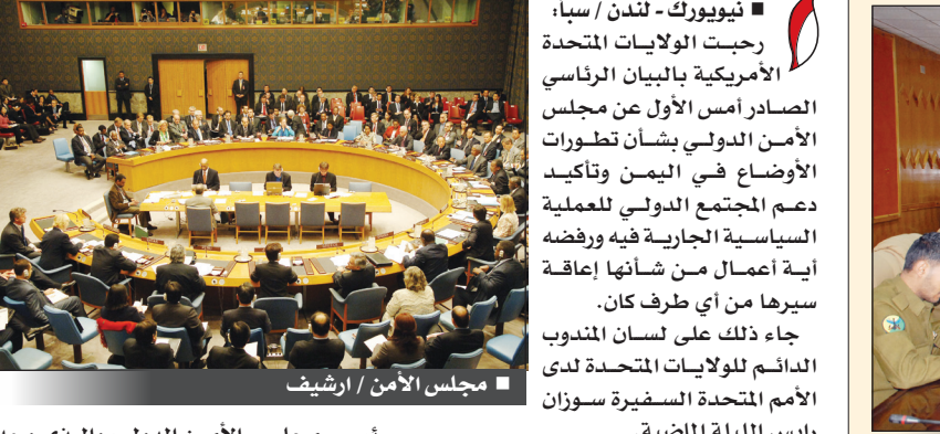
مجلس الأمن

نيويورك - لندن / سيأ : رحبت الولايات المتحدة الأمريكية ببيان الرئاسي الصادر أمس الأول عن مجلس الأمن الدولي بشأن تطورات الأوضاع في اليمن وتأكيد دعم المجتمع الدولي للعملية السياسية الجارية فيه ورفضه أية أعمال من شأنها إعاقة سيرها من أي طرف كان. جاء ذلك على لسان المندوب الدائم للولايات المتحدة لدى الأمم المتحدة السفيرة سوزان رايس الليلة الماضية. وقالت رايس : "لقد عبر مجلس الأمن الدولي من خلال هذا البيان عن دعمه لحوار وطني بقيادة يمنية وتشجيعه لمرحلة انتقالية شاملة تشمل الجميع". وشددت الدبلوماسية الأمريكية على أهمية ما جاء في البيان من تأكيد واضح على دعم مجلس الأمن الدولي لحماضية الأطراف المعركة للمرحلة الراهنة.. قائله: "لقد أكد مجلس الأمن استعداده لتبني إجراءات إضافية ضد أولئك الذين يتدخلون في المرحلة الانتقالية السياسية الجارية حالياً في اليمن". كما رحبت المملكة المتحدة بالبيان الرئاسي الذي أصدره مجلس الأمن الدولي أمس الأول لدعم العملية السياسية الجارية حالياً في اليمن وقبول مؤتمر الحوار الوطني الشامل المقرر انطلاقه في 18 مارس المقبل. وقال وزير الدولة البريطاني لشؤون الشرق الأوسط وشمال أفريقيا السيد اليستير برت في بيان صدر أمس في لندن: "ترحب ببيان