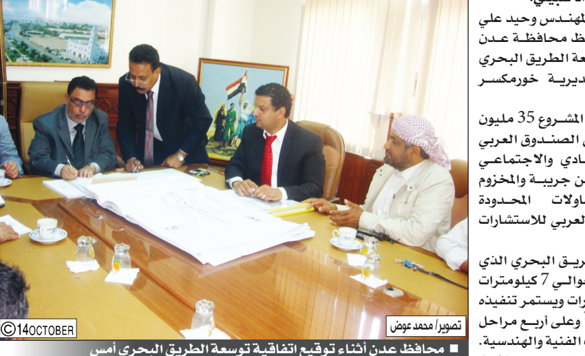
محافظ عدن أثناء توقيع اتفاقية توسعة الطريق البحري أمس

عدن / واد شيبلي: دشّن الاخ المهندس وحيد علي رشيد محافظ محافظة عدن أمس العمل بتوسعة الطريق البحري الذي يربط مديرية خورمكسر بالمضروعة. وتبلغ كلفة هذا المشروع 35 مليون دولار بتمويل من الصندوق العربي للإنماء الاقتصادي والاجتماعي وتنفذه شركة بن جريبة والمخزوم للتجارة والقنوات المحدودة وبإشراف المكتب العربي للاستشارات الهندسية. ويبلغ طول الطريق البحري الذي سيتم توسعته حوالي 7 كيلومترات وعلى 4 x 4 مسارات ويستمر تنفيذه حوالي 24 شهراً وعلى أربع مراحل وبأعلى المواصفات الفنية والهندسية. وعلى تصريح أدلى به محافظ محافظة عدن الاخ المهندس وحيد علي رشيد لوسائل الإعلام بالمحافظة أشار إلى أن تدشين العمل في هذا المشروع يأتي بمناسبة الاحتفال بالذكرى الأولى للتداول السلمي للسلطة في يوم 21 فبراير والتي من خلالها خرج الملايين لانتخاب الاخ المشير عبد ربه منصور رئيساً للجمهورية. وقال: بهذه المناسبة تم وضع الحجر الأساس لمشروع تنموي كبير في إطار محافظة عدن وهو مشروع العمل بتوسعة الطريق البحري الذي يربط مديريات محافظة عدن ويعتبر