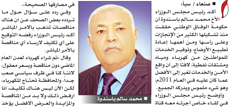
محمد سالم باسندوة

في مصارفها الصحيحة، وفي زده على سؤال حول ما تردده بعض الصحف عن أن هناك مناقصات تذهب بالأمير المباشر أكد رئيس الوزراء رفضه التوقيع على أي تكليف لارساء أي مناقصة بالأمر المباشر. وقال "تم شراء كهرباء لعدن العام الماضي دون مناقصة وبسعر معقول، لأننا كنا في ظرف سياسي صعب جداً، والمحافظة تحتاج للكهرباء، لكن الآن ليس هناك تكليف، أنا أرفض ذلك ولا بد من المناقصة والمزايدة والعرض الأفضل يؤخذ به..". وأكد رئيس الوزراء أن علاقته بالاخ الرئيس عبدربه منصور هادي رئيس الجمهورية جيدة جداً، وليس هناك تعارض أو تباين أو تنازع للسلطات أو الصلاحيات.. لافتاً الى الحرص على اجراء الانتخابات في موعدها المقرر في فبراير 2014م. وقال "بالطبع الامور ستتضح أكثر من خلال انعقاد مؤتمر الحوار الوطني وهذا شيء مهم جداً". وأشار الاخ باسندوة الى ان حملته الأكبر هو رؤية اليمن دولة مزدهرة ومتقدمة ومدتها متطورة وراقية.. داعياً المواطنين جميعاً الى نبذ العنف وترك السلاح، لان العنف ليس في مصلحة الوطن. وقال : "نستطيع ان نتعايش وان اختلفنا فلنحتكم الى القضاء دون اللجوء الى العنف". وتطرق رئيس مجلس الوزراء في سياق المقابلة الى ما ورثته الحكومة من اعباء ثقيلة من الماضي، بالإضافة الى ما تواجهه من محاولات افعال المشاكل والعراقيل امامها وكذا الخطوات المتخذة للتعامل مع القضايا ومعالجة المشاكل في المحافظات خاصة الجنوبية والشرقية، الى جانب التطرق الى الاشكالات الخاصة بمشروع قانون العدالة الانتقالية، وكذا ما يتعرض له من حملة طائلة من قبل بعض الاطراف.