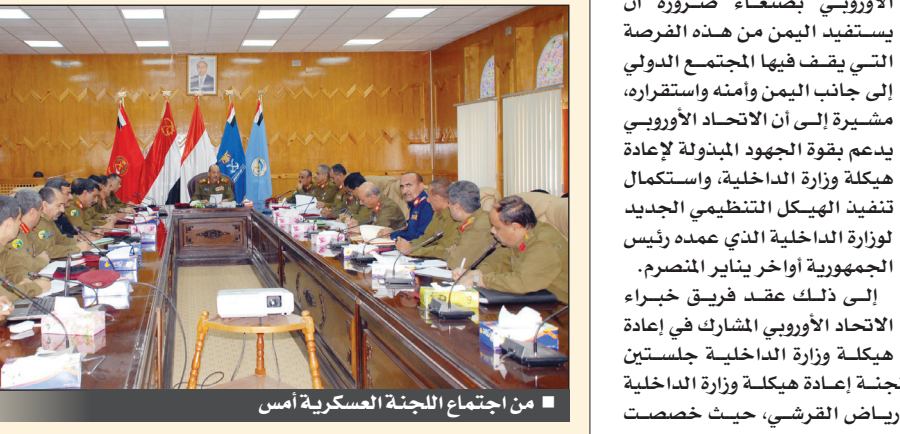
من اجتماع اللجنة العسكرية أمس

ستشارك في مناقشة العمل القاسمى خلال ترؤسه أمس اجتماعاً مشتركاً للجنة التنظيم والتقييم وفريق إعادة الهيكلة على ضرورة الإشراف المباشر على فرق العمل التخصصية المساعدة وتقديم المشورة اللازمة لهم لإنجاز مهامهم على الوجه المطلوب. وكان الاجتماع قد وقف أمام مشروع الإستراتيجية العسكرية للقوات المسلحة اليمنية والمتضمن الهدف والمهام الإستراتيجية والموقف السياسي والعسكري والتهديدات المؤثرة على الأمن القومي اليمني. ويشتمل المشروع على نقاط القوة لمصادر التهديدات والإمكانات المحددة لاستخدام القوات المسلحة، وكذا تحديد الاتجاهات والأهداف الإستراتيجية لكل اتجاه الى جانب توزيع وتركز وحدات القوات المسلحة. كما استعرض الاجتماع المقترح المقدم عن الحجم الأمثل للقوات المسلحة في السلم والحرب ومقارنته بما هو موجود في الواقع الفعلي للقوات المسلحة اليمنية.