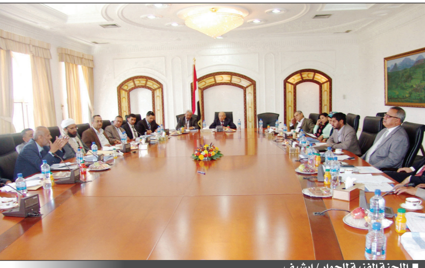
اللجنة الفنية للحوار

استعرضت اللجنة الفنية للإعداد والتحصير مؤتمر الحوار الوطني الشامل في اجتماعها أمس برئاسة رئيس اللجنة الدكتور عبدالكريم الأرياني، التقرير المقدم من مقرر اللجنة وأمينها العام الدكتور أحمد عوض بن مبارك حول نتائج التحليل للقوائم المقدمة من الأحزاب والحركات السياسية للتأكد من تطابقها مع النسب التي أقرتها اللجنة لتمثيل جنوب الوطن بنسبة لا تقل عن 50% والنساء بنسبة لا تقل عن 30% والشباب بنسبة لا تقل عن 20%. وأوضحت نتائج التحليل لقوائم الأحزاب والحركات السياسية أن القوائم غير مطابقة للنسب التي سبق وأن حددتها اللجنة، وخطبت جميع الأحزاب والحركات السياسية بضرورة الالتزام بالنسب عند تسليم قوائم ممثليها لمؤتمر الحوار، مبيّنة أن النسب تراوحت من صفر لتمثيل الشباب وصفر لتمثيل النساء و50% لتمثيل الجنوب في قائمة تمثيل المجلس الوطني