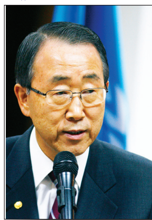
بان كي مون

واشنطن / سبأ : أشاد الأمين العام للأمم المتحدة بان كي مون بالتجربة اليمنية في التغيير السلمي. جاء ذلك خلال لقاء القائم بأعمال سفارة اليمن بواشنطن والمراقب الدائم لليمن في منظمة الدول الأمريكية عادل علي السنيني للأمين العام للأمم المتحدة في اجتماع بروتوكولي عقد امس الاول على شرف الأمين العام للأمم المتحدة بان كي مون الذي يزور العاصمة واشنطن حاليا، في مقر منظمة الدول الأمريكية، حضرها رئيس وأعضاء المجلس الدائم للمنظمة الدولية. ودعا الأمين العام للأمم المتحدة الحكومة اليمنية إلى مواصلة الجهود في سبيل إنجاح المرحلة الانتقالية. وقد أعرب المراقب الدائم لليمن عن شكره لقيادة وحكومة وشعباً لجهود الأمم المتحدة الثمرة، ووقوفها إلى جانب اليمن في ظل التحديات الهائلة والتحديات المتشابكة. واستعرض السنيني آخر المستجدات في مسألة التحضير لمؤتمر الحوار الوطني، موضحاً أن كافة الأحزاب السياسية اليمنية سلمت امس قوائم ممثليها للحوار. ودعا المنظمة الدولية إلى حث المانحين على الإسراع بالإيفاء بتعهداتهم تجاه اليمن خاصة أن العاصمة البريطانية ستحتضن في السابغ من شهر مارس القادم المؤتمر الوزاري لمجموعة أصدقاء اليمن.