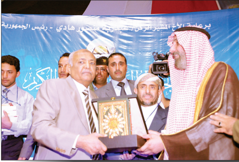
رئيس الوزراء خلال حضوره الحفل السنوي الذي اقامته الجمعية الخيرية لتعليم القرآن الكريم

رئيسي لتشريعاتنا، وسندافع عنه بكل ما نستطيع، والله سيحفظ الاسلام وسيبقي عليه في ازدهار وانتعاش.. وأعلن رئيس الوزراء عن تدشين حملة تبرع لبناء جامعة القرآن الكريم والعلوم الإسلامية.. مؤكدا ان وجود جامعة لتدريس القرآن شيء ضروري ويجب ان ندعمها ونوفر لها كل التسهيلات.. وقال : ونحن في الحكومة بدورنا سنوفر لها كل التسهيلات اللازمة.. كما أعلن رئيس الوزراء بهذا الخصوص عن تبرع الدولة بمبلغ 100 مليون ريال لصالح جامعة القرآن الكريم والعلوم الإسلامية، وتبرع الأخ رئيس الجمهورية بخمسة ملايين ريال، وتبرعه شخصيا بمليونين ريال. وتطرق الأخ باسنودة في سياق كلمته الى ما يتعرض له من حملة اعلامية ظالمة.. وقال : كلما تعرضت لهذه الحملة الظالمة اشعر اني على حق، لان الطرف الذي يوجه لي هذه الاقتراعات هو من قتل وجرح الشباب والان يدعي انه يدافع عنهم.. وأكد حرص الحكومة على مساعدة أسر الشهداء ورعاية