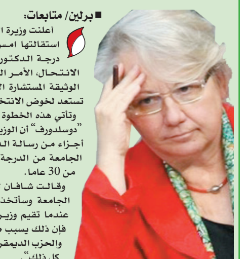
رئيس اتحاد الأدباء والكتاب اليمنيين/عدن

برلين / متابعات: أعلنت وزيرة التعليم الألمانية "أنيته شافان" استقالتها أمس السبت، بعد تجديدها من درجة الدكتوراه التي تحملها بسبب مزاعم الانتحال. الأمر الذي سبب إحراجاً لحليتها الوثيقة المشاركة الألمانية "أنجيلا ميركل". وهي تستعد لخوض الانتخابات للفوز بفترة ولاية ثالثة. وتأتي هذه الخطوة بعد 4 أيام من إعلان جامعة "دوسلدورف" أن الوزيرة شافان نسخت بشكل متعمد أجزاء من رسالة الدكتوراه من آخرين. وجردها الجامعة من الدرجة التي منحها إيهاها قبل أكثر من 30 عاماً.