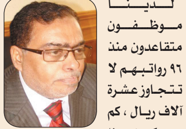
وحيد رشيد محافظ عدن

إن الجنوبيين مع أي حلول سلمية تهدف إلى حل قضية شعب الجنوب حلاً عادلاً يرتضيه ويقبل به شعب الجنوب وفق ضوابط وأسس حددناها في رسالتنا لوفد مجلس الأمن الدولي الذي زار صنعاء مؤخراً .