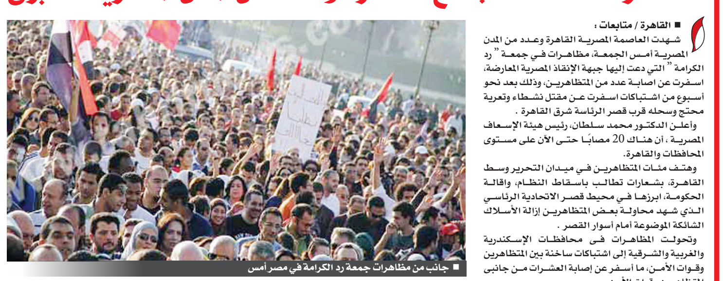
جانب من مظاهرات جمعة رد الكرامة في مصر أمس

منزل الرئيس مرسي، مؤكداً أنه تم سلحهم على الأرض ووضعهم في سيارة شرطة. وشهد محيط منزل الرئيس بالزقازيق، حالة من الكر والفر بين قوات الأمن والمظاهرين، الذين يواصلون محاصرة منزل الرئيس شارع الاستاد. وبدأت الاشتباكات عندما حاول المظاهرون اختراق الحاجز الأمني، فحدث جذب وشد بينهم وبين القوة المكلفة بتأمين المنزل، ما دفع قوات الأمن لإطلاق الغاز المسيل للدموع بكثافة لتفريق المظاهرين الذين حاصروا