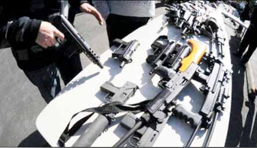
شحنة الأسلحة المهربة المضبوطة في ميناء عدن