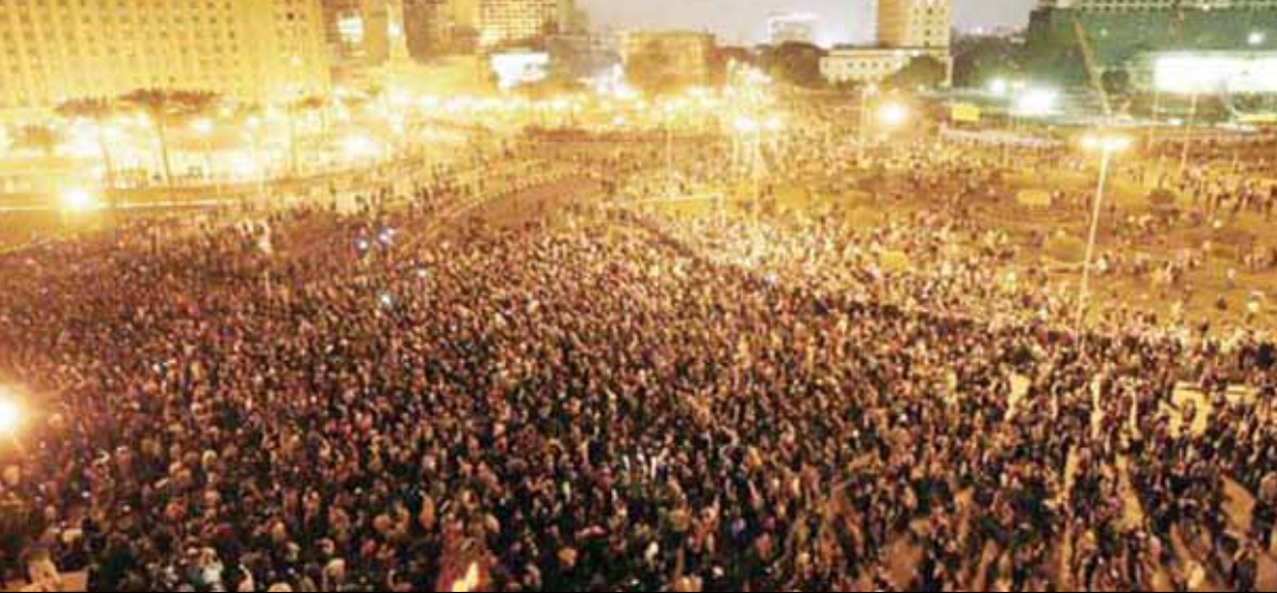
ميدان التحرير في القاهرة كما بدا ليلة أمس