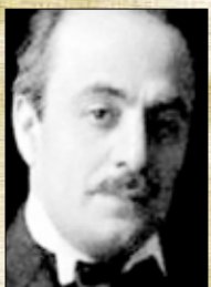
جبران خليل جبران

لورأيت الكل يمشي عكسك.. لا تتردد امش..حتى لو أصبحت وحيدا فالوحدة خير من أن تعيش عكس نفسك لإرضاء غيرك!