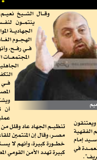
الشيخ نبيل نعيم

■ القاهرة/ متابعات، كشف الشيخ نبيل نعيم زعيم تنظيم الجهاد في مصر، في تصريحات خاصة لصحيفة "الوطن" المصرية عن أن المصريين الذين يقاطعون الأثر في مالي وجنوب الجزائر وشاركوا في عملية اختطاف الرهائن الغربية في منشة الغاز في "عين أمانس" هم من الجيل الثاني لتنظيم الجهاد المصري، وانضموا لتنظيم القاعدة ويعتقدون الفكر التكفيري، مشيرا إلى أن مرجعيتهم الفقهية هي كتب مفتي تنظيم الجهاد الدكتور سيد امام الشهير بالدكتور فضل خاصة كتابي "العمدة في أعداد العدة"، و"الجامع في طلب العلم الشريف". وقال الشيخ نعيم، إن هؤلاء الجهاديين ينتمون لنفس تنظيمات السلفية الجهادية الموالية للقاعدة التي نفذت الهجوم الغادر على الجنود المصريين في رفح، وأنهم جميعا يؤمنون بأن المجتمعات العربية تعيش حاليا في الجاهلية الثانية، وأكد أن هؤلاء التكفيريين أصبحوا منتشرون في المحافظات المصرية إلى جانب سيناء، ويشكلون خلايا نائمة ويمكن ان تستيقظ وتقوم بأي عملية في مصر، إلا أن زعيم تنظيم الجهاد عاد وقلل من خطر تنظيم القاعدة في مصر، وقال إن المنتمين للقاعدة في مصر لا يشكلون خطورة كبيرة، وأنهم لا يستطيعون القيام بعمليات كبيرة تهدد الأمن القومي المصري،