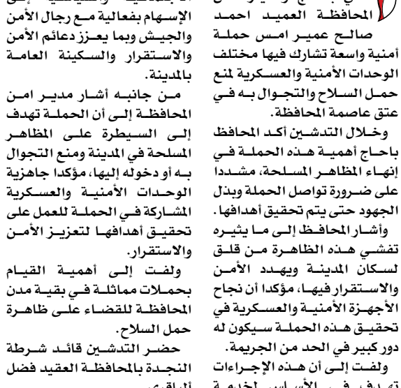
دشن محافظ شبوة احمد علي باحاج ومدير أمن المحافظة العميد احمد صالح عمير امس حملة أمنية واسعة شارك فيها مختلف الوحدات الأمنية والعسكرية لمنع حمل السلاح والتجوال به في عتق عاممة المحافظة.

■ شبوة/ سبأ، دشّن محافظ شبوة احمد علي باحاج ومدير أمن المحافظة العميد احمد صالح عمير امس حملة أمنية واسعة شارك فيها مختلف الوحدات الأمنية والعسكرية لمنع حمل السلاح والتجوال به في عتق عاممة المحافظة. وخلال التدشين أكد المحافظ باحاج أهمية هذه الحملة في إنهاء المظاهر المسلحة، مشددا على ضرورة تواصل الحملة وبتدليل الجهود حتى يتم تحقيق أهدافها. وأشار المحافظ إلى ما يثيره تفتيش هذه الظاهرة من قلق لسكان المدينة ويهدد الأمن والاستقرار فيها، مؤكدا أن نجاح الأجهزة الأمنية والعسكرية في تحقيق هذه الحملة سيكون له دور كبير في الحد من الجريمة. ولفت إلى أن هذه الاجراءات تهدف في الأساس لخدمة المواطنين وحمايتهم من مخاطر حمل السلاح، داعيا القيادات الاجتماعية والسياسية إلى الإسهام بفعالية مع رجال الأمن والجيش وبما يعزز دعائم الأمن والاستقرار والسكينة العامة بالمدينة. من جانبه أشار مدير امن المحافظة إلى أن الحملة تهدف إلى السيطرة على المظاهر المسلحة في المدينة ومنع التجوال به أو دخوله إليها، مؤكدا جاهزية الوحدات الأمنية والعسكرية المشاركة في الحملة للعمل على تحقيق أهدافها لتعزيز الأمن والاستقرار. ولفت إلى أهمية القيام بحملات مماثلة في بقية مدن المحافظة للقضاء على ظاهرة حمل السلاح. حضر التدشين قائد شرطة النجدة بالمحافظة العقيد فضل الباقري.