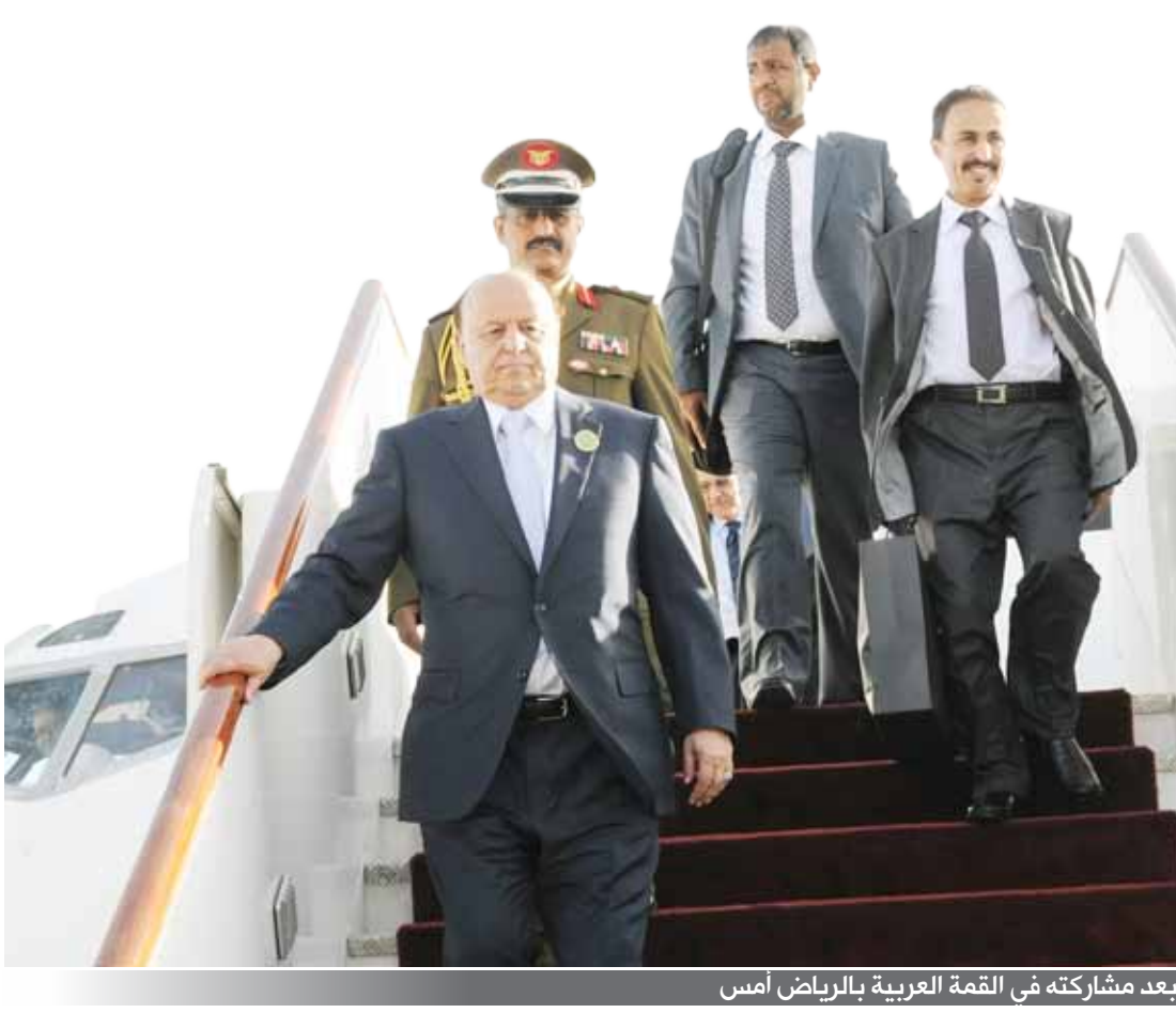
رئيس الجمهورية لدى عودته إلى صنعاء بعد مشاركته في القمة العربية بالرياض أمس