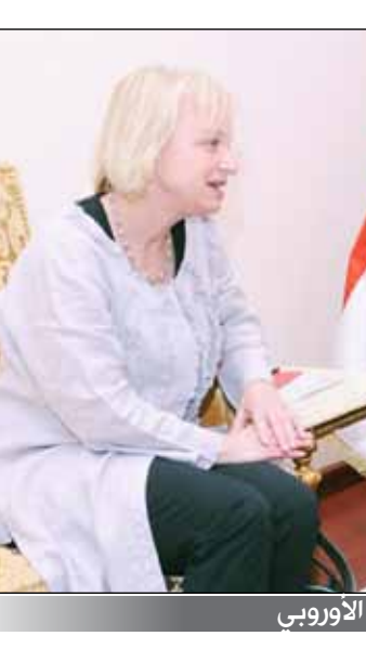
رئيس الوزراء لدى استقبله رئيسة بعثة الاتحاد الأوروبي

■ صنعاء/ سبأ، استقبل رئيس مجلس الوزراء الأخ محمد سالم باسندوة مستشار الأمين العام للأمم المتحدة ومبعوثه الخاص إلى اليمن جمال بن عمر، والوفد المرافق له الذي يزور بلادنا حاليا، لمتابعة استكمال تنفيذ بقية بنود المبادرة الخليجية وألياتها التنفيذية المزمنة. وجرى خلال اللقاء مناقشة مستجدات الأوضاع الراهنة في اليمن، وعلى وجه الخصوص التحضيرات الجارية لعقد مؤتمر الحوار الوطني الشامل، والجهود المبذولة لتهيئة كافة الأجواء الملائمة واللائمة لإنجاحه. وتطرق اللقاء إلى الاسناد الإقليمي والدولي للمرحلة الانتقالية الجارية في اليمن، والتنسيق المشترك للتسريع بتخصيص التعهدات التي أعلنها الأشقاء والأصدقاء من الدول والمنظمات المانحة لدعم اليمن، بما يعكس إيجابا على التنمية الاقتصادية وتعزيز عوامل