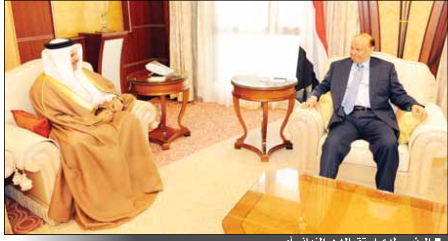
الرئيس لدى استقباله د. الزباني أمس

ومباركته ودول مجلس التعاون الخليجي على القرارات التي اتخذت مؤخرا وكل الإجراءات والخطوات التي يتخذها الرئيس عبد ربه منصور هادي والتي كان آخرها قرار إعادة هيكلة القوات المسلحة وبالاتظار قريبا لقرار إعادة هيكلة وزارة الداخلية . وأكد الدكتور الزباني ووقوف المجتمع الدولي ومجلس الأمن ودول الخليج مع اليمن حتى تحقيق كامل أهداف المرحلة الانتقالية . 6