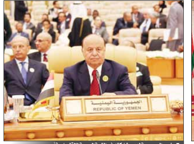
رئيس الجمهورية لدى مشاركته في القمة العربية الاقتصادية أمس

وعدد الرئيس محمد مرسى التحديات المشتركة التي تواجه الأمة العربية، ومن بينها كيفية التعامل مع الآثار السلبية للعولمة والمنافسة القوية للصادرات الأقل كلفة والتراجع عن الاعتماد على البحث والتطوير العلمي . وأكد أهمية دراسة كيفية التنسيق المشترك في مواجهة الاضطرابات المالية والتقلبات في أسعار الصرف والتصدي لمشكلة البطالة المرتفعة خاصة لدى الشباب العربي مقارنة بدول العالم الأخرى وضرورة رفع نوعية التعليم والتدريب والتأهيل خاصة في قطاع التعليم الفني لسد نقص الكوادر العربية في المجالات المؤهلة . كما أشار إلى أن من التحديات التي تواجه الأمة العربية تجاوز إشكاليات المرأة في المجتمع ودورها في التنمية وإدارة عملية الإصلاح والتطوير، خاصة فيما يتعلق بمجال تبني السياسات الاقتصادية وتوفير الموارد 6