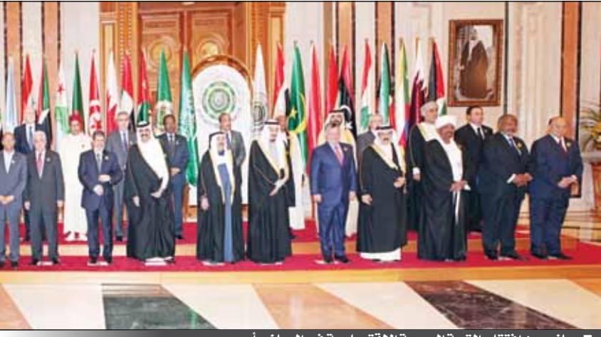
جانب من افتتاح القمة العربية الاقتصادية في الرياض أمس

وعدد الرئيس محمد مرسى التحديات المشتركة التي تواجه الأمة العربية، ومن بينها كيفية التعامل مع الآثار السلبية للعولمة والمنافسة القوية للصادرات الأقل كلفة والتراجع عن الاعتماد على البحث والتطوير العلمي . وأكد أهمية دراسة كيفية التنسيق المشترك في مواجهة الاضطرابات المالية والتقلبات في أسعار الصرف والتصدي لمشكلة البطالة المرتفعة خاصة لدى الشباب العربي مقارنة بدول العالم الأخرى وضرورة رفع نوعية التعليم والتدريب والتأهيل خاصة في قطاع التعليم الفني لسد نقص الكوادر العربية في المجالات المؤهلة . كما أشار إلى أن من التحديات التي تواجه الأمة العربية تجاوز إشكاليات المرأة في المجتمع ودورها في التنمية وإدارة عملية الإصلاح والتطوير، خاصة فيما يتعلق بمجال تبني السياسات الاقتصادية وتوفير الموارد 6