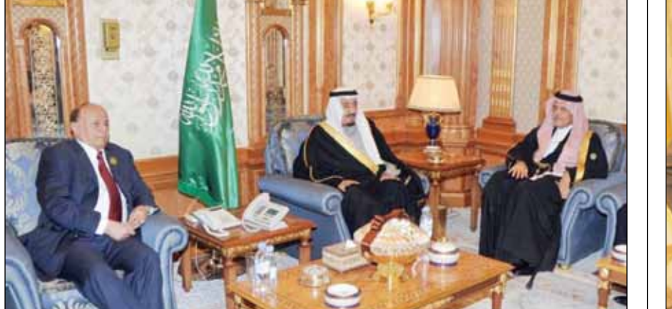
ولي العهد السعودي أثناء استقباله رئيس الجمهورية أمس

■ الرياض / سبأ: استقبل صاحب السمو الملكي الأمير سلمان بن عبدالعزيز ولي العهد رئيس المؤتمر الاقتصادي التنموي الاجتماعي الثالث الذي دشنت أعماله مساء أمس بالرياض في جناحه الخاص في صالة المؤتمرات بالرياض الأخ الرئيس عبد ربه منصور هادي رئيس الجمهورية . وجرى خلال اللقاء مناقشة القضايا والموضوعات 6