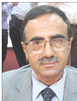
الخضر ناصر لصور