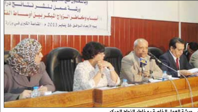
في ورشة العمل الخاصة بمخاطر الزواج المبكر