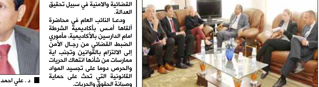
وزير التخطيط يبحث مع رئيسة بعثة المفوضية الأوروبية جملة من القضايا

صنعاء / سيا: بحث نائب وزير التخطيط والتعاون الدولي الدكتور مطهر العباسي أمس مع رئيسة بعثة المفوضية الأوروبية بصعاء، "بثينا موشايت" جملة من القضايا المتصلة بتعزيز التعاون المشترك بين