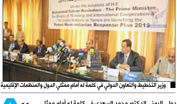
وزير التخطيط والتعاون الدولي في كلمة له أمام ممثلي الدول والمنظمات الإقليمية