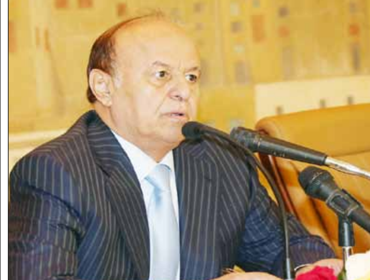
رئيس الجمهورية يتحدث أمام أعضاء مجلسي النواب والوزراء