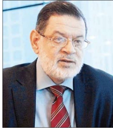
د. ثروت الخرباوي

القاهرة/ متابعات: تحدى الدكتور «ثروت الخرباوي» - القيادي المنشق عن جماعة الإخوان المسلمين -، وحافظ أبو سعدة رئيس المنظمة المصرية لحقوق الإنسان، القوى التي أصدرتها الهيئة الشرعية للإصلاح والتنمية بتدريج تهنة الأقباط بمناسبة الأعياد الدينية، وقدموا التهنة للأقباط، علماء بأن الهيئة تضم عدداً من كبار علماء الإسلام في مصر وعلى رأسهم المهندس خيرت الشاطر النائب الأول لمرشد جماعة الإخوان المسلمين، وحازم صلاح أبوإسماعيل، والشيخ صفوت حجازي. وقال «الخبراوي» عبر حسابه الشخصي على موقع التدوين الاجتماعي «تويتر»: «الهيئة الشرعية للإصلاح تحرم تهنة المسيحيين بالمناسبات الدينية، لذلك لايفوتني أن أقول لإخواننا المسيحيين كل سنة وأنتم بخير، بمناسبة أعياد الميلاد.»