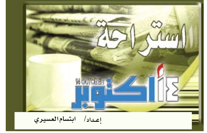
إعداد / ابتسام العسيري

وقد قام العلماء بصنع نماذج ثلاثية الأبعاد طبق الأصل عن المخلوق باستخدام برامج الكمبيوتر. ومن حسن حظ العلماء بأن المنطقة التي تم العثور فيها على الحفريات هي منطقة غير حضارية و هي منطقة شبه استوائية كانت تعيش بها الصدفيات ولم تتأثر بالرماد البركاني و أنها جمدت في حينها و كل ذلك ساعد كثيراً في الحفاظ عليها بشكل جيد جداً.