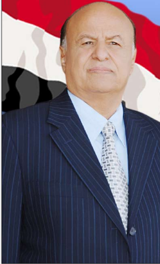
المشير/عبدربه منصور هادي رئيس الجمهورية - القائد الأعلى للقوات المسلحة