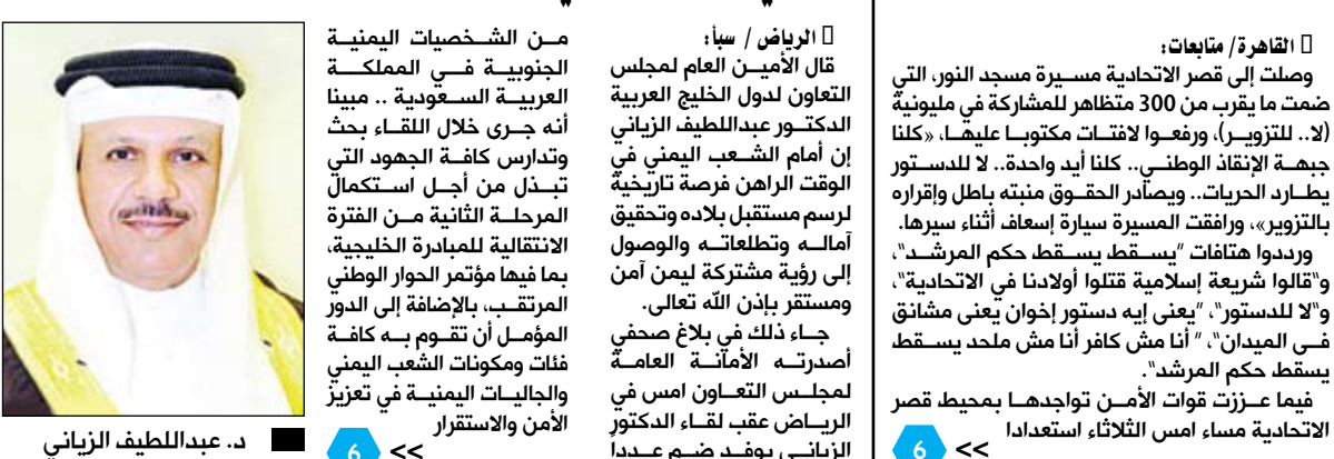
د. عبد اللطيف الزباني

صنعاء / سبأ: قال الأمين العام لمجلس التعاون لدول الخليج العربية الدكتور عبداللطيف الزباني إن أمام الشعب اليمني في الوقت الراهن فرصة تاريخية لرسم مستقبل بلاده وتحقيق آماله وتطلعاته والوصول إلى رؤية مشتركة ليمن أمن ومستقر بإذن الله تعالى. جاء ذلك في بلاغ صحفي أصدرته الأمانة العامة والمرشدين والكوادر السياسية في الرياض عقب لقاء الدكتور الزباني بوفد ضم عددا