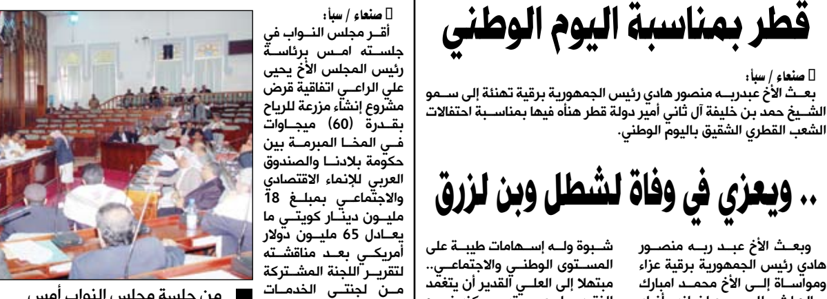
من جلسة مجلس النواب أمس

صنعاء / سبأ: أقر مجلس النواب في جلسته أمس برئاسة رئيس المجلس الأخ يحيى علي الراعي اتفاقية قرض مشروع إنشاء مزرعة للرياح بقدرة (60) ميجاوات في المخا المبرمة بين الحكومة بلاندا والصندوق العربي للإنماء الاقتصادي والاجتماعي بمبلغ 18 مليون دينار كويتي ما يعادل 65 مليون دولار أمريكي بعد مناقشته لتقرير اللجنة المشتركة من لجنتي الخدمات والتنمية والنمط حول هذا القرض. وبعد التزام الجانب الحكومي ممثلاً بوزير الكهرباء والطاقة الدكتور صالح سميع بتوصيات المجلس التي أكد من خلالها المجلس العمل على توفير التمويلات الأخرى المكتملة لمبلغ هذا القرض وفي أسرع وقت لاستكمال كافة الإجراءات المتعلقة