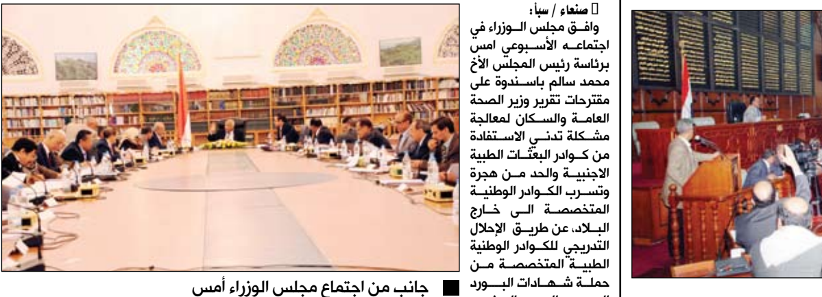
جانب من اجتماع مجلس الوزراء أمس

صنعاء / سبأ: وافق مجلس الوزراء في اجتماعه الأسبوعي أمس برئاسة رئيس المجلس الأخ محمد سالم باسندوة على مقترحات تقرير وزير الصحة العامة والسكان لمعالجة مشكلة تدهور البعثات الطبية الأجنبية والحد من هجرة وتسرب الكوادر الوطنية المتخصصة إلى خارج البلاد، عن طريق الإحلال التدريجي للكوادر الوطنية الطبية المتخصصة من حملة شهادات البورد العربي والبورد اليمني وشهادات الزمالات العربية واليمينية بدلا عن كوادر البعثات الطبية الأجنبية العاملين في المرافق الصحية اليمنية في المحافظات النائية، على أن يعطى الكادر الوطني نفس المبالغ والمميزات التي تعطى للأطباء والكادر الصحي الاجنبي، بشرطه أن يكون متفرغاً بشكل كامل. ووافق مجلس الوزراء على مشروع الدراسة الخاصة بتطوير الصناعات التعدينية في المنطقة الغربية والمتطلبات