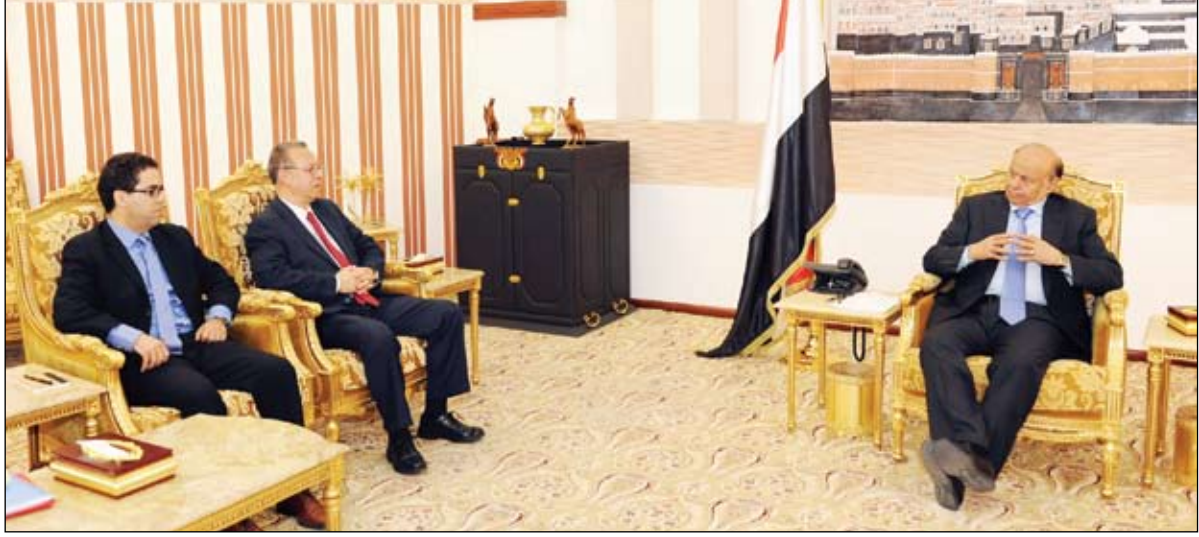
رئيس الجمهورية لدى استقباله جمال بن عمر أمس

صنعاء / سبأ: التقى الرئيس عبد ربه منصور هادي رئيس الجمهورية، أمس المبعوث الأممي الخاص إلى اليمن جمال بن عمر، الذي عاد إلى صنعاء لمباشرة مهامه المتصلة بالمتابعة والإشراف من قبل الأمم المتحدة لمجريات تنفيذ التسوية السياسية التاريخية في اليمن والمنبثقة عن المبادرة الخليجية صنعاء / سبأ: وأيتها التنفيذية في اليمن وقراري مجلس الأمن 2014 و 2051 . وجرى خلال اللقاء مناقشة التطورات والمستجدات الأخيرة في مسار العملية والتحديات الجارية بصورة متكاملة للولوج الى مؤتمر الحوار الوطني الشامل بعد ان استكملت اللجنة الفنية كافة مهامها ورفعت