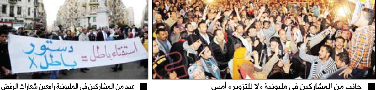
عدد من المشاركين في المليونية رافعين شعارات الرفض

القاهرة / متابعات: وصلت إلى قصر الاتحادية مسيرة مسجد النور، التي ضمت ما يقرب من 300 متظاهر للمشاركة في مليونية «لا للتزوير»، ورفعوا لافتات مكتوباً عليها: «كلنا جبهة الإنقاذ الوطني... كلنا أيد واحدة... لا للدستور بطارد الحريات.. ويصادر الحقوق منبته باطل وإقراره بالتزوير»، ورافقت المسيرة سيارة إسعاف أثناء سيرها. وردوا هتافات "يسقط بسقط حكم المرشد"، وقالوا "شريعة إسلامية قتلوا أولادنا في الاتحادية"، و"لا للدستور"، "يعني إيه دستور إخوان يعني مشاقق في الميدان"، "أنا مش كافر أنا مش ملحد يسقط بسقط حكم المرشد". فيما عززت قوات الأمن تواجداً بحميط قصر الاتحادية مساء أمس الثلاثاء استعداداً