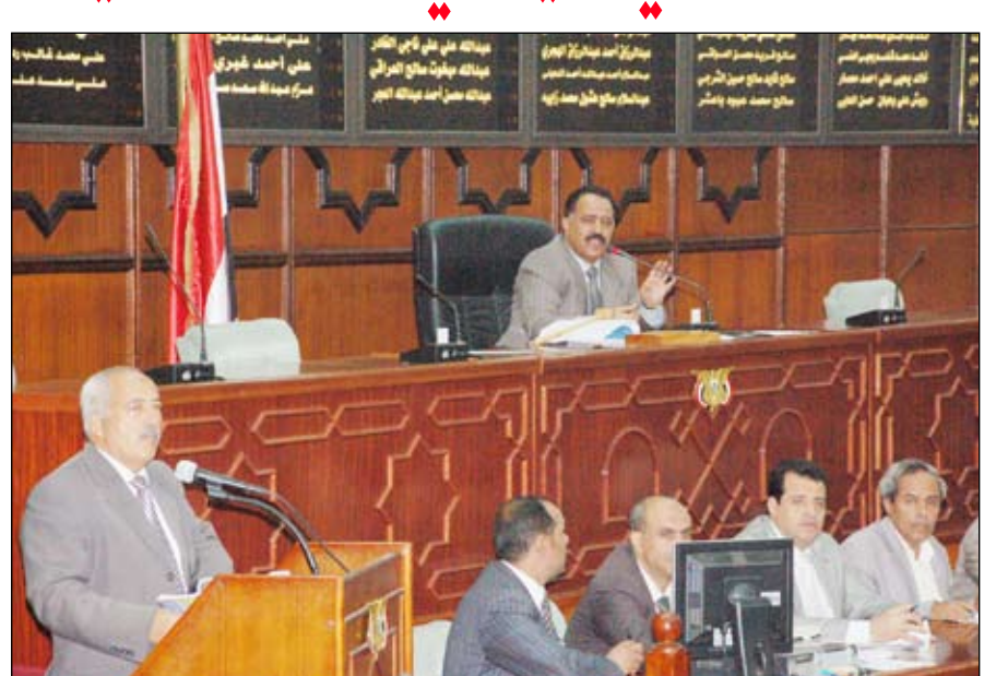
مجلس النواب في جلسته أمس

صنعا / سيا: عبر مجلس النواب في جلسته المنعقدة أمس برئاسة رئيس المجلس الأخ/ يحيى علي الراعي عن تقديره العالي للعسكريين والمدنيين الذين يعملون بصمت وتقان وتكرار اللذات من أجل اكتشاف المهربات وعوامل ارتكاب الجريمة قبل وقوعها ومنهم الذين عملوا على اكتشاف شحنة المسدسات التي تم ضبطها في ميناءي عدن والحديدة. وفي الجلسة أوضح رئيس المجلس أن مثل تلك الأعمال تعكس مدى الوعي الوطني لتلك الكفاءات بقضايا الوطن في سبيل ترسيخ دعائم الأمن والاستقرار والسكنية العامة والحفاظ على وحدة الوطن أرضاً وإنساناً الأمر