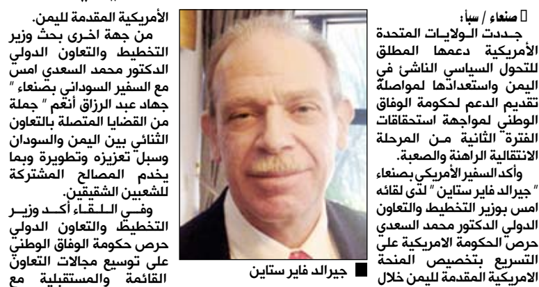
صنعا / سيا: جيرالد فاير ستاين

صنعا / سيا: جيرالد فاير ستاين الأمريكية المقدمة لليمن. من جهة أخرى بحث وزير التخطيط والتعاون الدولي الدكتور محمد السعدي أمس مع السفير السوداني بصنعا، جهاد عبد الرزاق أتهم " جملة من القضايا المتصلة بالتعاون الثنائي بين اليمن والسودان وسبل تعزيزه وتطويره وبما يخدم المصالح المشتركة للشعبين الشقيقين. وفي اللقاء أكد وزير التخطيط والتعاون الدولي حرص حكومة الوفاق الوطني على توسيع مجالات التعاون القائمة والمستقبلية مع السودان ووجوب يتواءم العلاقات التاريخية المتجددة بين الشعبين اليمني والسوداني. من جهته جدد السفير السوداني بصنعا حرص الحكومة السودانية على تعزيز أطر التعاون الثنائي مع اليمن منوهاً بالمتغيرات السياسية التاريخية التي تشهدها اليمن. وناقش الجانبان التفاصيل المتعلقة بالاستعدادات الجارية لاستكمال إجراءات تخصيص المساعدات التمويلية المقدمة لليمن خلال مؤتمر الرياض للماثنيين والاجتماع الرابع لمجموعة أصدقاء اليمن "نيويورك" إلى جانب القضايا المتصلة باتجاهات الدعم الخاصة بالمنحة