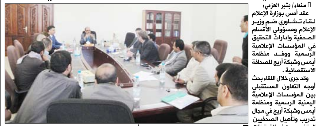
وزير الإعلام في اللقاء التشاوري مع مسؤولي الأقسام الصحفية وإدارات التحقيق في المؤسسات الإعلامية

صنعا / بشير العزمي: عقد أمس بوزارة الإعلام لقاءً تشاورياً ضم وزير الإعلام ومسؤولي الأقسام الصحفية وإدارات التحقيق في المؤسسات الإعلامية الرسمية ووفد منظمة أيس وشبكة أربع للصحافة الاستقصائية. وقد جرى خلال اللقاء بحث وضع التعاون المستقبلي بين المؤسسات الإعلامية اليمنية الرسمية ومنظمة أيس وشبكة أربع في مجال تدريب وتأهيل الصحفيين المتخصصين في التحقيقات الاستقصائية وذلك من خلال إنشاء وحدات للتحقيقات الاستقصائية في المؤسسات الإعلامية الرسمية. وخلال اللقاء أكد وزير الإعلام العمراني أهمية دور الإعلام في ترسيخ القيم الإيجابية في المجتمع وتجسيد الولام والسلام والمحبة. وقال إن وزارة الإعلام جعلت من العام الجاري 2012م عاماً للحرية الصحفية بشكل مطلق من أجل تحقيق مناعة ذاتية للإعلاميين والصحفيين بحيث يحصل التهذيب من الداخل وليس عبر القوانين. وأضاف أن الإعلاميين والصحفيين بقدر ما هو متاح لهم من حرية كاملة ومطلقة فإن