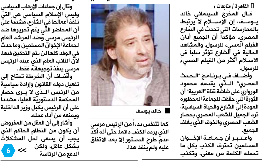
صنعا / مناعيات: خالد يوسف

صنعا / مناعيات: خالد يوسف قال المخرج السينمائي خالد يوسف، إن الإسلام لا يرتبط بالممارسات التي تحدث في الشارع المصري، مؤكداً أن الجميع أدان الفيلم المسيء للرسول، والمشاهد الحالية في الشارع تؤثر سلباً في الإسلام أكثر من الفيلم المسيء للرسول. وأضاف في برنامج "الحدث المصري" الذي يقدمه محمود الرواوي على شاشة قناة "العربية" أن الثورة التي حققت للجماعة المحظورة العودة إلى الشارع والحياة السياسية، ترد الجميل للشعب المصري بحصار الشعب المصري والخوف الذي يغلفه المجتمع. واعتبر أن جماعة الإخوان المسلمين تحترف الكذب بكل ما تحمله الكلمة من معنى، وتكذب وقال إن جماعات الإرهاب السياسي وليس الإسلام السياسي هي التي تنفذ أعمالها في الشارع، مشدداً على أن المحاصر التي يتم تحريرها ضد الرئيس مرسي وضد المرشد العام لجماعة الإخوان المسلمين وما حدث في الوند كلها لن يتم التحقيق فيها، لأن النائب العام الذي عينه الرئيس مرسي ينفذ توجيهاته فقط. وأضاف أن الشرطة تحتاج إلى تفعيل دولة القانون وإرادة سياسية من الرئيس الذي لا يرى حصار المحكمة الدستورية العليا، مشدداً على أن النائب العام يكيل وزير الداخلية ويمنعه من أداء عمله. وأشار إلى أن العقل من المفروض أن يكون من النظم الحاكم الذي يجب أن يسعى لحل المشكلات بشكل عاقل، ولكن الدفاع من الرئاسة