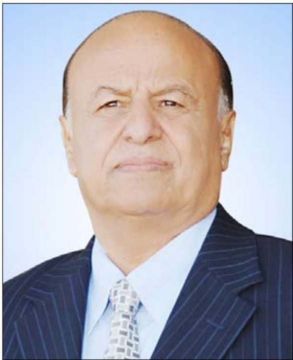
صنعا / سيا: بعث الأخ الرئيس عبدربه منصور هادي رئيس الجمهورية برقية تهنئة إلى الرئيس يوسف محمود رئيس جمهورية النيجر، بمناسبة احتفالات شعب النيجر بذكرى إعلان الجمهورية.