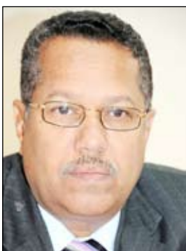
د. أحمد ياسين دغار

صنعاء / سيا: استكملت وزارة الاتصالات وتقنية المعلومات المراحل النهائية لمشروع الخريطة الرقمية الموحدة للجمهورية اليمنية الذي تبلغ كلفته خمسة ملايين دولار. وأوضح وزير الاتصالات وتقنية المعلومات الدكتور أحمد عبيد بن دغر أن المشروع الذي نفذته شركة فوجيرو مابيس الألمانية المتخصصة في نظم المعلومات الجغرافية يشمل تصويراً جويًا بالألوان لجميع أراضي الجمهورية اليمنية بما في ذلك عواصم المحافظات والمدن والمديريات والغزل والقرى والجزر والمناطق