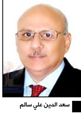
سعد الدين علي سالم

□ العديدة / أحمد كخديف، يعقد غدا الأربعاء في محافظة الحديدة اجتماع موسع بحضور وزير الصناعة والتجارة الدكتور سعد الدين علي سالم بن طالب ومحافظ المحافظة أكرم عبد الله عطية وإدارة مكتب المنطقة الصناعية وإدارة شركة تهامة لتطوير وتشغيل المنطقة الصناعية سيتم من خلاله مناقشة ما تم إقراره في الاجتماع السابق الذي عقد في المحافظة منتصف العام الجاري من تنفيذ لعدد من المشاريع الاستثمارية في المنطقة والصعوبات والعراقيل