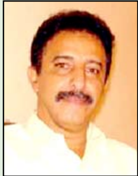
حافظ مصطفى علي

هي لا تشبه القيادات التقليدية، عرفت من كتب، شديدة التأثر أمام القضايا الإنسانية، ربما تدهشك باهتمامها بتفاصيل شخصية عادية جداً، أو شخص معاق كبير في السن يحمل من ذكريات العمر مواقف تعبق بتقاليد الماضي، ترى في اختلاف المواقف السياسية رحمة في إطار ما هو إنساني ووطني وعقلاني، تفيض شباباً وحبوبة ومرحاً، كثيرة هي الأدوار الدرامية التي عاشتها، رافقت في مسيرتها السياسية قادة اليمن شمالاً وجنوباً، وكلما كانت أكثر قرباً من الحاكم كانت أكثر خدمة للمكونين والتكالي في الطرف المعارض، تمدها بشجاعة وإنسانية