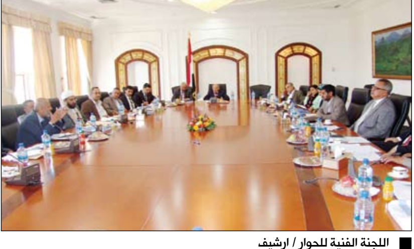
اللجنة الفنية للحوار