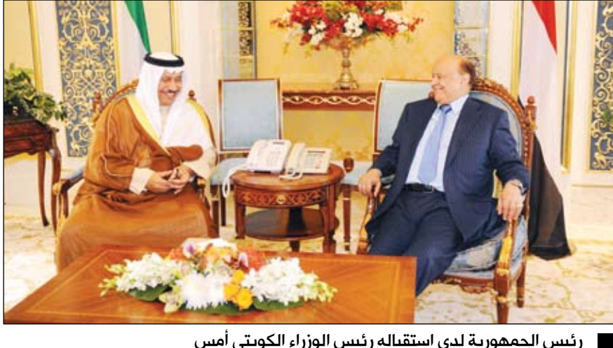
رئيس الجمهورية لدى استقباله رئيس الوزراء الكويتي أمس

استقبل الأخ عبدربه منصور هادي رئيس الجمهورية ظهر أمس في مقر إقامته بقصر البيان بالجمهورية العاصمة الكويتية رئيس وزراء دولة الكويت سمو الشيخ جابر المبارك الحمد الصباح. وجرى خلال اللقاء مناقشة عدد من القضايا المتصلة بالعلاقات الأخوية المشتركة وما يهم البلدين والشعبين الشقيقين، في مختلف المجالات الاستثمارية والسياسية وغيرها. واستعرض الأخ الرئيس مسار التسوية السياسية التاريخية في اليمن، وما تم إنجازه من شوط وصفه بالشوط الكبير، حيث خرجت اليمن من المرحلة الخطيرة إلى وضع أفضل، مشيراً إلى أن المبادرة الخليجية واليتها التنفيذية المزمعة كانت المخرج المبشر والمناسب للوصول إلى اتفاق شكلت بموجبه حكومة الوفاق الوطني وأجريت الانتخابات الرئاسية المبكرة التي مثلت تحولا استراتيجيا وتاريخيا بما مكن من الحفاظ على النهج الديمقراطي وخروج اليمن إلى بر الأمان.