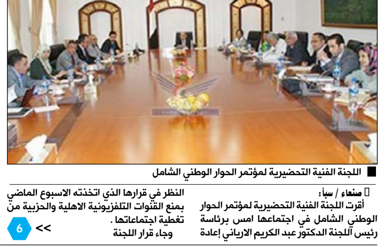
اللجنة الفنية التحضيرية لمؤتمر الحوار الوطني الشامل