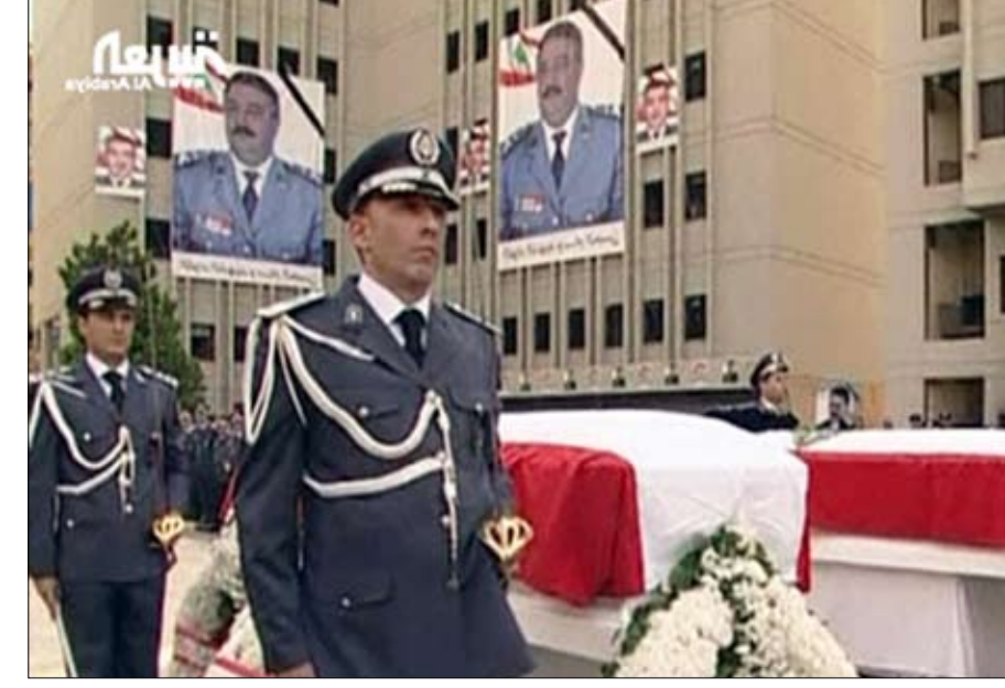
وقال صحنوي -في مقابلة سابقة مع الجزيرة- إن فريقه السياسي مستعد للمشاركة في طولة الحوار التي دعا إليها رئيس الجمهورية.

وعلى وقع هذه التطورات، أعلن ميقاتي أول من أمس السبت أنه وضع استقالته بعهدة رئيس الجمهورية الذي طلب منه «فترة زمنية» لكي يتشاور مع هيئة الحوار الوطني.