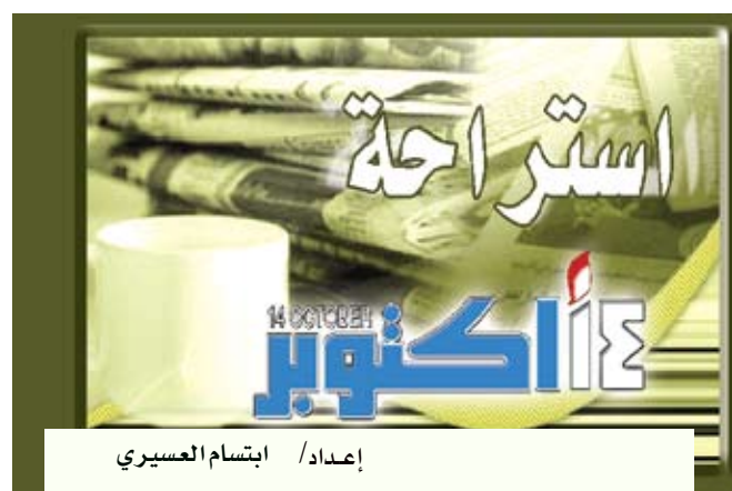
إعداد / ابتسام العسيري

واكتشف كرامسكي وفريق البحث معه أن المضادات هذه تمكنت