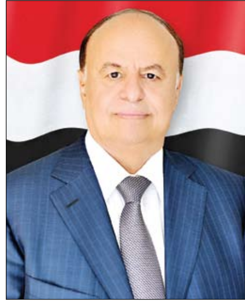
رئيس مجلس القضاء الأعلى

هذا مجلس القضاء الأعلى في اجتماعه الأسبوعي أمس، المنعقد برئاسة رئيس المجلس القاضي الدكتور علي ناصر سالم، الأخ عبد ربه منصور هادي رئيس الجمهورية وكافة منتميني السلطة القضائية وكل أبناء الشعب اليمني بمناسبة احتفالات شعبنا بالعيد الـ49 لثورة 14 أكتوبر المجيدة، وبمناسبة قدوم عيد الأضحي المبارك، داعياً المولى أن يعيد هذه المناسبة على الجميع بالخير واليمن والبركات. وفي بداية الاجتماع رحب مجلس القضاء بعضو المجلس القاضي يحيى عبدالله حسن العنسي رئيس محكمة استئناف أمانة العاصمة، متمنياً له التوفيق والنجاح في مهامه الجديدة بمجلس القضاء. واستعرض المجلس البيان الصادر عن فرعي المنتدى القضائي بأمانة العاصمة ومحافظتي صنعاء والجوف بشأن ما تضمنه بيان نقابة المحامين فرع صنعاء الصادر بتاريخ 6 أكتوبر الجاري من نيل من مكانة القضاء وقديسيته وهيبته. وفي الاجتماع الذي حضره ممثلو فروع المنتديات القضائية بكل من أمانة العاصمة، صنعاء، ذمار، عمران، إب، بناء على طلبهم، استمع المجلس من أسباب الخلافات بين بعض المحامين وبعض القضاة. وأبدى المجلس أسفه لما يحدث باعتبار هذه الخلافات تآكل هبة وقديسية القضاء، وكلف المجلس فروع المنتدى القضائي بالمحافظات للاتقاء بالمحامين في المحافظات والعمل على حل هذه الخلافات لما من شأنه تعزيز هبة القضاء من خلال الالتزام الحازم بنصوص