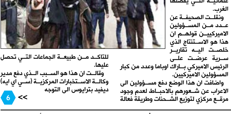
نيويورك / متابعات : ذكرت صحيفة نيويورك تايمز أمس الاثنين أن غالبية الأسلحة التي تنقل سرا إلى سوريا تذهب إلى جماعات متشددة وليس إلى المنظمات الأكثر علمانية التي يفضلها الغرب.

ونقلت الصحيفة عن عدد من المسؤولين الأميركيين قولهم إن هذا هو الاستنتاج الذي خلصت إليه تقارير سرية عرضت على الرئيس الأميركي باراك أوباما وعدد من كبار المسؤولين الأميركيين. وأضافت أن هذا الوضع دفع مسؤولين في الاعراب عن شعورهم بالاحباط لعدم وجود مخرج مركزي لتوزيع الشحنات وطريقة فعالة