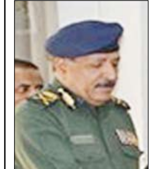
ناصر علي لشخ

وأوضح نائب وزير الداخلية أن المجلس الأعلى للشرطة أوصى بترقية (8) ضباط إلى رتبة عميد و(506) ضباط من مختلف الرتب العسكرية ومن ضمنهم خريجو الكليات العربية والأجنبية.