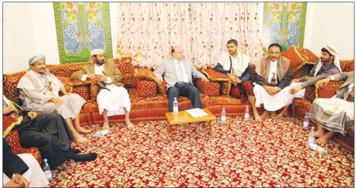
رئيس الجمهورية لدى استقباله مشايخ وأعيان ووجهاء محافظة شبوة أمس

صنعاء / سيا: استقبل الأخ عبد ربه منصور هادي رئيس الجمهورية أمس مجموعة من مشايخ وأعيان ووجهاء محافظة شبوة الذين جاؤوا لتهنئته بسلامة العودة بعد زيارته الخارجية الطيبة والمثمرة، وإطلاعه كذلك على أوضاع محافظة شبوة واحتياجاتها الملحة في قطاعات التنمية المختلفة.. معبرين عن سعادتهم بهذا اللقاء وطرح همومهم وتطلعاتهم. وقد عبر الأخ الرئيس عبد ربه منصور هادي عن مسعده بهذا اللقاء.. وقال «إن كل ما تم تناوله وطرحه من مواضيع وقضايا مشروعة تم المحافظة وإبناؤها سيتم العمل على حلها وتذليلها». وأشار إلى الوضع الذي تسلم فيه مقاليد السلطة في اليمن في ظل أوضاع صعبة ومعقدة وموارد محدودة ومعمنة.. لافتاً أن ذلك أيضاً لا يعفي الدولة من القيام بواجباتها في تنفيذ وتحقيق المشاريع والاستحقاقات المشروعة في مختلف مناحي الحياة وقطاعات التنمية المختلفة وفي ضوء ظروف أمانة ومستقرة. وقال «نحن اليوم على اعتبار مرحلة جديدة عنونها الأبرز الحوار الوطني الشامل الذي لا يستثنى احداً والذي يتطلع إليه كل أبناء الوطن لإرساء معالم الدولة اليمنية المدنية الحديثة وصولاً إلى نظام الحكم الرشيد المبني على العدالة والمساواة بين مختلف أبناء المجتمع».