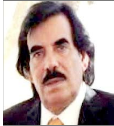
علي سالم البيض

دعوا محمد علي أحمد أبناء الجنوب إلى الوقوف صفا واحدا في وجه الإرادات المنطلقة من الولايات الشخصية أو الحزبية أو الإقليمية والتي لا تخدم سير وانتصار القضية الجنوبية العادلة التي تواجه الكثير من المؤامرات التي تستهدف وحدة الصف من خلال الدعوات المنطلقة من المصالح الأثنية.