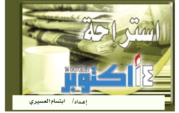
إعداد: / استلام العسيري

البرلين / مناجات : أكدت دراسة حديثة أجراها فريق من الباحثين الألمان أن الوجبات التي تحتوي على الخبز الأسمر تعتبر غنية بالكربوهيدرات التي ترفع نسبة السكر في الدم بمعدل أبطأ مما يحدث عند تناول منتجات الدقيق الأبيض والحلوى قليلة الألياف الغذائية، ما يؤدي إلى استمرار تأثيرها لفترات أطول.