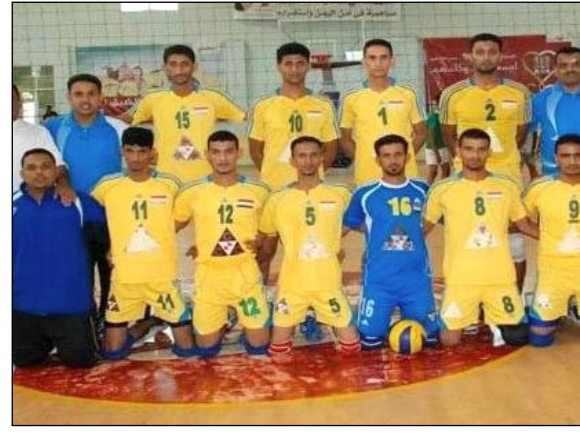
فريق شباب القطن حيث انتهت نتيجة هذا الشوط بفوز الشعلة 25 مقابل 17 لشباب القطن .

منذ البداية الأولى لهذا الشوط وجدنا لاعبي الشعلة كلهم عزيمة وإصرار على الفوز لا غير وهذا ما كان لهم حيث استطاعوا أن يفوزوا فيه بنتيجة 25 مقابل 20 لشباب القطن . وكانت النتيجة النهائية 3 - صفر للشعلة * صباح اليوم الخميس تقام مباراتان الأولى تجمع الشرطة مع الشعلة وهذه المباراة مهمة لفريق الشعلة وكذلك لفريق الشرطة . والمباراة الثانية تجمع بين المتصدر الصقر وشباب القطن وهي مباراة مهمة للصقر وحاسمة .