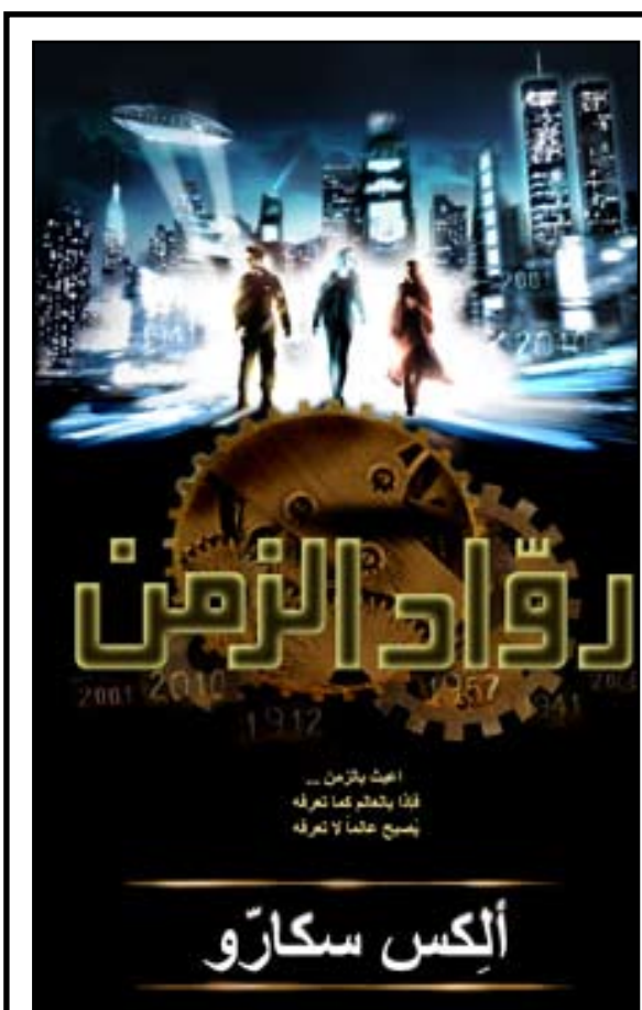
كما حازت عام 2010 على جائزة أفضل كتاب إخراجا في معرض بيروت الدولي لكتاب (فاتن).

Red House Award. وحاز على جائزة ترجمت إلى أكثر من 30 لغة وبيعت منها 77 مليون نسخة حتى اليوم. هذه نبذة من الرواية: اعيش بالزمن وكان من المفترض أن يموت ليام أوكونر في البحر عام 1912. وكان من المفترض أن تموت مادي كارتر على متن طائرة عام 2010. وكان من المفترض أن تموت سال فيكرام في حريق عام 2026. ومع ذلك، قبيل موتهم بلحظات، ظهر شخص وقال لكل منهم (امسك يدي ... جدي).