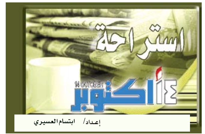
إعداد: / ابتهام العسيري

يمتلئ السوق التجاري بالعديد من المنتجات التي تتفعل بأن لها القدرة على مساعدتك في التخلص من السمنة في منطقة البطن دون أن تبذل أي مجهود، ولكن ما لا تعلمه أن تلك المنتجات قد تشكل خطراً على صحتك، كما أن الواقع يشهد أنها لا تفيده، ومع هذا فسنبخبرك بطرق التخلص من الكرش دون تمارين رياضية. 1. لا تهمل تناول وجبة الإفطار الوجبة الأهم، فبحسب ما قمته بحث علمي حديث، ثبت أن من يتجنبون تناول وجبة الإفطار تحديداً، يميلون لتناول كم أكبر من الطعام باقي اليوم، أو يكتفون من تناول الوجبات الصغيرة بين الوجبات الرئيسية طوال اليوم، ليعوضوا