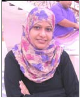
أثار محمد علي