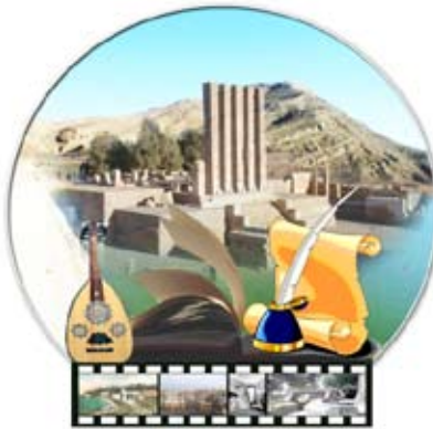
إشراف /فاطمة رشاد

وهي رواية تصور القلق النفسي والوجودي الذي يتعرض لها إنسان العصر رغم ما وصل إليه من تقدم طبي وعلمي، وحين يختار الطبيب في تفسير ما يبرسه من ظواهر يراها خارقة للعادة