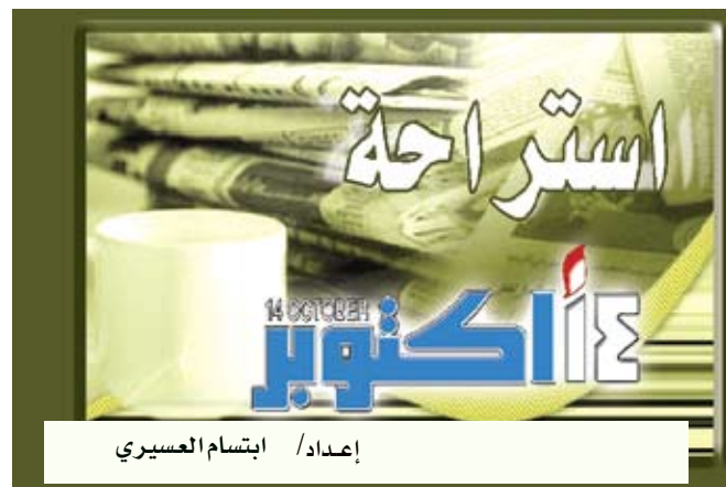
إعداد: / ابتسام العسيري

تفقد قلعته بهلاء بولاية بهلاء بسلسلة عمان محافظة الداخلية، والتي تم إدراجها ضمن مواقع التراث العالمي منذ العام 1987 وتضم: واحة بهلاء بأسواقها التقليدية وحاراتها القديمة ومساجدها الأثرية وسورها الذي يبلغ طوله ما يقارب 13 كلم ويعود تاريخ بنائه إلى فترة ما قبل الإسلام. ويعود تاريخ قلعة بهلاء إلى الألف الثالث قبل الميلاد. ويبلغ طول واجهتها الجنوبية حوالي 112م كما يبلغ طول الواجهة الشرقية حوالي 114م. ومن الواضح أن سور بهلاء الممتد لمسافة 12 كم تقريبا، بشرافته واحتواؤه على فتحات إطلاق النار وبيوت الحراس، كان قد صمم لأغراض الدفاع. وتتميز محافظة الداخلية باختلالها مكانة مميزة من سفوح جبال الحجر