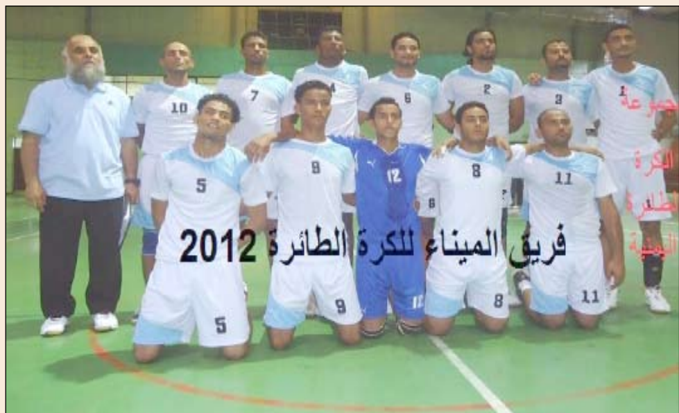
فريق الميناء لكرة الطائرة 2012