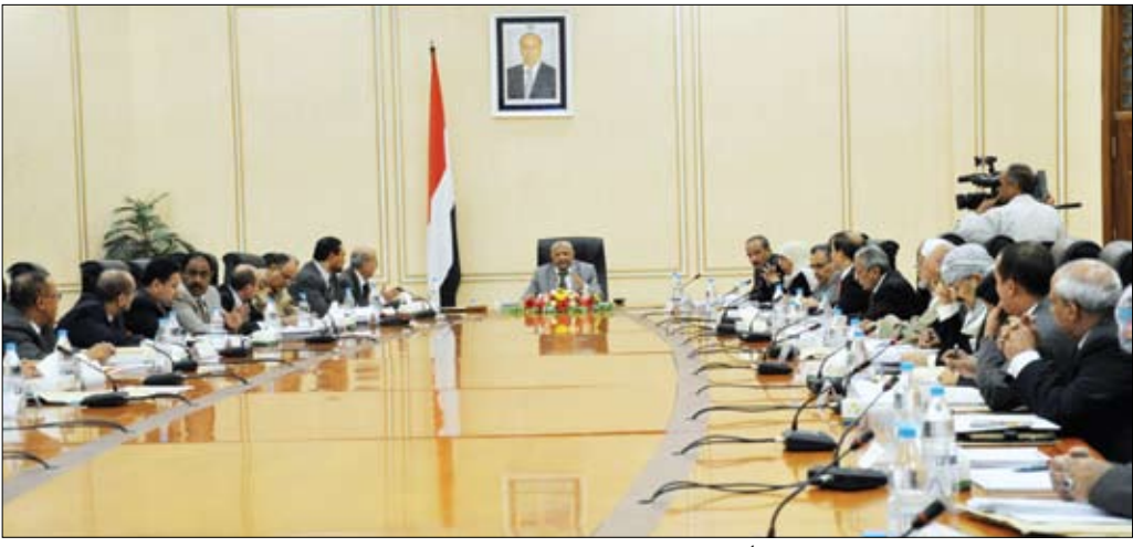
جانب من اجتماع مجلس الوزراء أمس

صنعاء / سبأ: وكان المجلس قد وقف في اجتماعه وتضم وزراء الدفاع والداخلية والاتصالات وتقنية المعلومات والتخطيط والتعاون الدولي ووزير الدولة عضو مجلس الوزراء حسن شرف الدين تتولى وضع الإجراءات التنفيذية لهذه التوجيهات، بناء على ما تم طرحه في الاجتماع، مؤكداً التزام الحكومة الكامل بالعمل بهذه التوجيهات ومسئولتها لكل الإجراءات التي يتخذها من قبل لجانه الدائمة، بالإضافة إلى ما يستجد من أعمال تفرزها الحياة اليومية والمتصلة بمهام المجلس بجانيه والتشريعي والرقابي. وكان المجلس قد وقف في اجتماعه وتضم وزراء الدفاع والداخلية والاتصالات وتقنية المعلومات والتخطيط والتعاون الدولي ووزير الدولة عضو مجلس الوزراء حسن شرف الدين تتولى وضع الإجراءات التنفيذية لهذه التوجيهات، بناء على ما تم طرحه في الاجتماع، مؤكداً التزام الحكومة الكامل بالعمل بهذه التوجيهات ومسئولتها لكل الإجراءات التي يتخذها من قبل لجانه الدائمة، بالإضافة إلى ما يستجد من أعمال تفرزها الحياة اليومية والمتصلة بمهام المجلس بجانيه والتشريعي والرقابي.