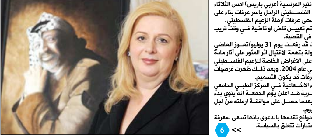
باريس / مآبوعات: فتحت نيابة مدينة نانثير الفرنسية (غربي باريس) امس الثلاثاء تحقيقاً في وفاة الزعيم الفلسطيني الراحل ياسر عرفات بناء على الدعوى التي قدمتها سهي عرفات أرملة الزعيم الفلسطيني. ومن المتوقع ان يتم تعيين قاض او قاضية في وقت قريب للإشراف على التحقيق في القضية. وكانت سهي عرفات قد رفعت يوم 31 يوليو/تموز الماضي دعوى ضد جهة مجهولة بتهمة الإغتيال اثر العثور على آثار مادة البولونيوم المشعة على الاغراض الخاصة للزعيم الفلسطيني الراحل الذي توفي في عام 2004. وبعد ذلك ظهرت فرضيات ترجح بان سبب وفاة عرفات قد يكون التسميم. وكان معهد الفيزياء الإشعاعية في المركز الطبي الجامعي بمدينة لوزان السويسرية قد أعلن يوم الجمعة أنه يتوي بدء فحص رفات عرفات بعدما حصل على موافقة إرملته من أجل البحث عن آثار البولونيوم. وفسرت أرملة عرفات دفاعاً تقدمها بالدعوى بانها تسعى لمعرفة الحقيقة بعيداً عن أي اعتبارات تتعلق بالسياسة.