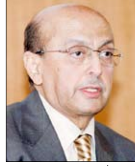
د. أبو بكر عبد الله القربي

في المجالات التنموية والاقتصادية وغيرها. من جانبه أكد السفير الياباني على عمق العلاقات الثنائية المتميزة التي تربط الشعبين اليمني والياباني، واصفاً إيها بأنها علاقة متينة وقوية منذ الأزل.. مؤكداً أن حكومة بلاده ستواصل دعمها التنموي للحكومة اليمنية في مختلف المجالات ومنها المجال الأمني ومكافحة الإرهاب. وفي اللقاء أشاد وزير الداخلية بالجهود التي تبذلها الحكومة اليابانية في إعادة بناء العلاقات التعاون مع الحكومة اليابانية والاستفادة من الخبرات اليابانية