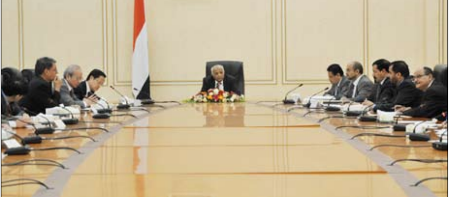
رئيس الوزراء لدى ترؤسه اجتماع سفراء وممثلي المنظمات والهيئات الدولية المانحة لليمن

صنعا / سيا: ترأس رئيس مجلس الوزراء الأخ محمد سالم باسندوة أمس اجتماعاً ضم عدداً من سفراء وممثلي المنظمات والهيئات الدولية المانحة لليمن، لمناقشة خطة بناء مشروع "الاستجابة الطارئة لتنمية