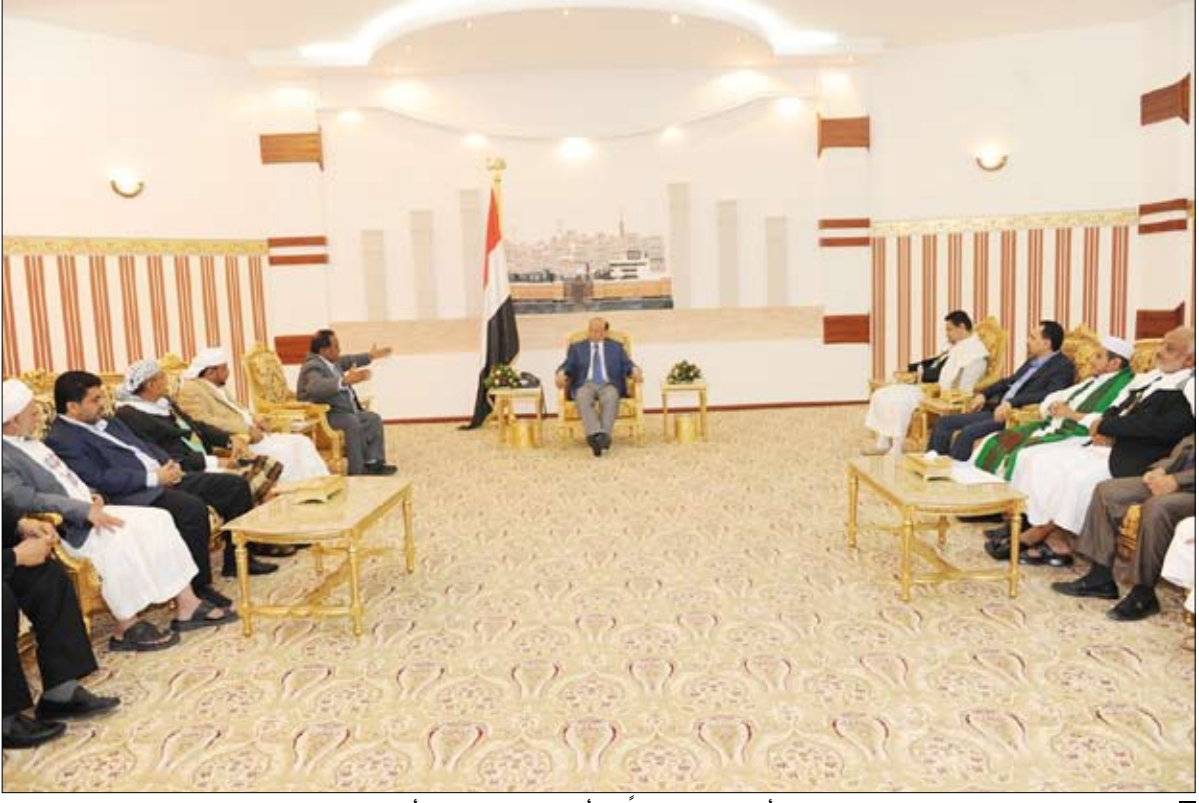
رئيس الجمهورية لدى استقبله محافظ الحديدة أكرم عطية وعددًا من أعضاء مجلس النواب أمس