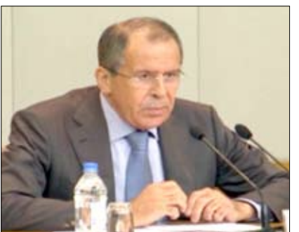
وزير الخارجية الروسي سيرغي لافروف

صنعا / سبأ: وقال: "لا أتوقع أن تنسحب القوات السورية من المدن والقرى من جانب واحد"، مذكراً أن "مجلس الأمن اعترف بأن المعارضين لا يحترمون حقوق الإنسان في مناطق سورية". وأعرب لافروف عن قلقه من الوضع في سوريا الذي "يزداد سوءاً"، داعياً "الأسد وأطراف المعارضة المسلحة" إلى وقف "متزامن" للاقتتال. وكشف أن موسكو تدعم أي قرار يدعمه الشعب السوري". أكد وزير الخارجية الروسي سيرغي لافروف أن موسكو لا تدعم "بشار الأسد، وإنما تدعم خطة عنان وما تم الاتفاق عليه"، كاشفاً أن «بشار الأسد لن يرحل لأنه يتمتع بدعم جزء كبير من الشعب السوري». وكشف لافروف خلال مؤتمر صحفي قائلًا: «إنجزنا كثيراً لدفع النظام السوري على الموافقة على خطة عنان»، مشدداً على ضرورة «التأثير على كافة أطراف النزاع في سوريا».